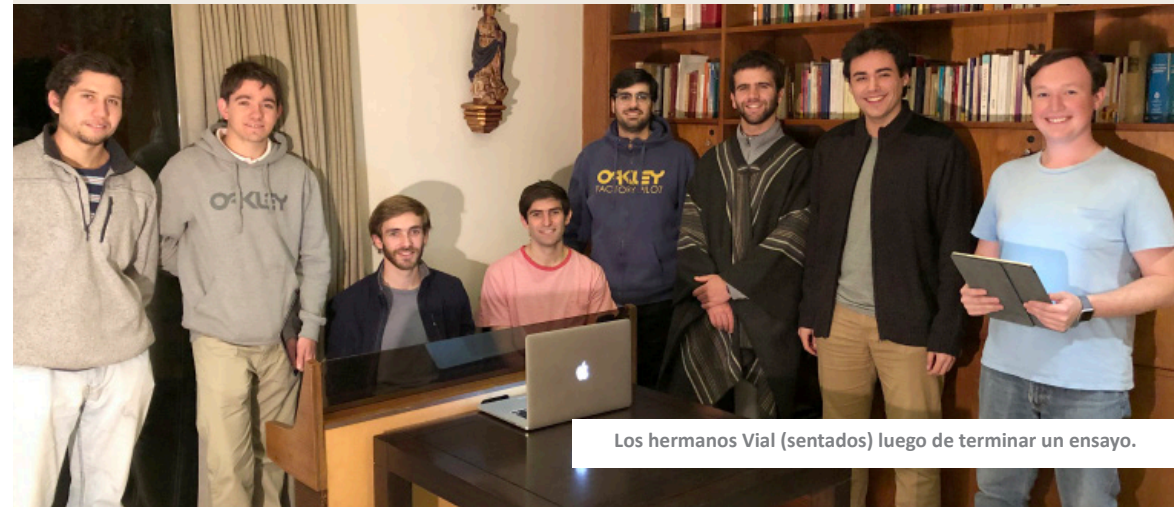
Los hermanos Vial (sentados) luego de terminar un ensayo.

es POTENTE que CON EL CANTO podamos ACOMPAÑAR la Liturgia