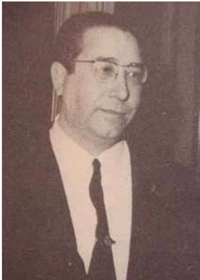
José Luis Villar Palasí