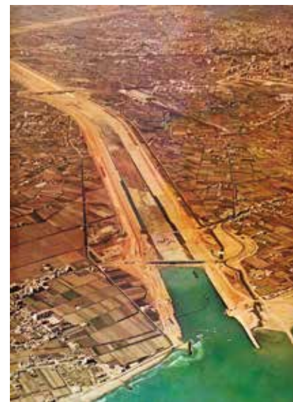
El nuevo cauce del Turia en 1969.

Pocos meses después 4 , Vicente Mortes vino a Valencia para dar una conferencia titulada “Educación y Desarrollo”. Su tesis, expuesta ante la flor y nata de autoridades y empresarios fue que Valencia, España, necesitaba técnicos y obreros cualificados en su proceso de paulatino desarrollo; “no solo porque el trabajo profesional se ha “tecnificado” ya extraordinariamente –dijo–, sino porque las continuas innovaciones exigen una formación profesional profunda y flexible en capas cada vez más extensas de la población activa”. Tecnócratas y falangistas ya andaban realizando