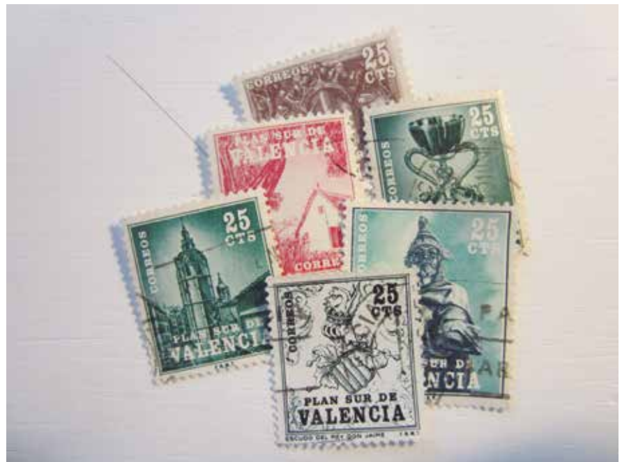
Sellos del Plan Sur de Valencia

Sesenta años después de la inundación, en este siglo XXI, Valencia sigue terminando proyectos que dimanan de aquel "cambio de decorado" del siglo anterior. El Parque Central, que aprovecha parte de la playa de vías de Renfe, es el ejemplo más evidente en el campo ferroviario, donde hay aún ideas pendientes. Pero a finales de 1960, la aprobación en las Cortes de la Ley del Plan Sur dio un vuelco histórico a la ciudad: la desviación del Turia por un nuevo cauce, la Solución Sur, permitió, o si se quiere obligó, a que fuera renovada la red de accesos por carretera, el plan de accesos ferroviarios, la red urbana de alcantarillado, más la de riegos huertanos, y el plan general urbanístico. Todo eso se hizo, básicamente en dos décadas de intensa transformación, los sesenta y los setenta. La ciudad, que estaba asediada por unos 250 pasos a nivel --los periódicos hablaban del "cinturón" o el "dogal de hierro"-- empezó a