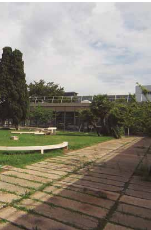
El núcleo fundacional de la Universidad Politécnica de Valencia, en la actualidad