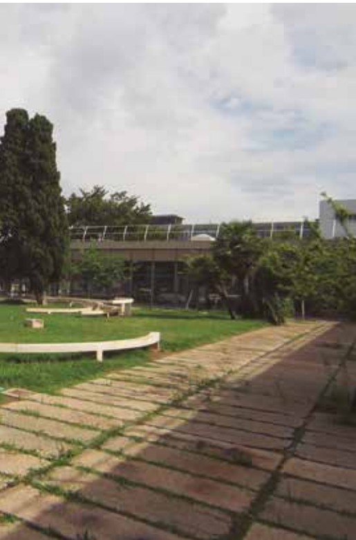
El núcleo fundacional de la Universidad Politécnica de Valencia, en la actualidad

grandes maniobras en las esferas del poder y Vicente Mortes, que por entonces era uno de los preceptores del joven Juan Carlos de Borbón, no ocultaba ni su adscripción ni sus objetivos. La educación, dentro de los planes de desarrollo, era sustancial para responder a “las exigencias de la justicia social” para permitir “el desenvolvimiento de la libertad y la dignidad de la persona”.