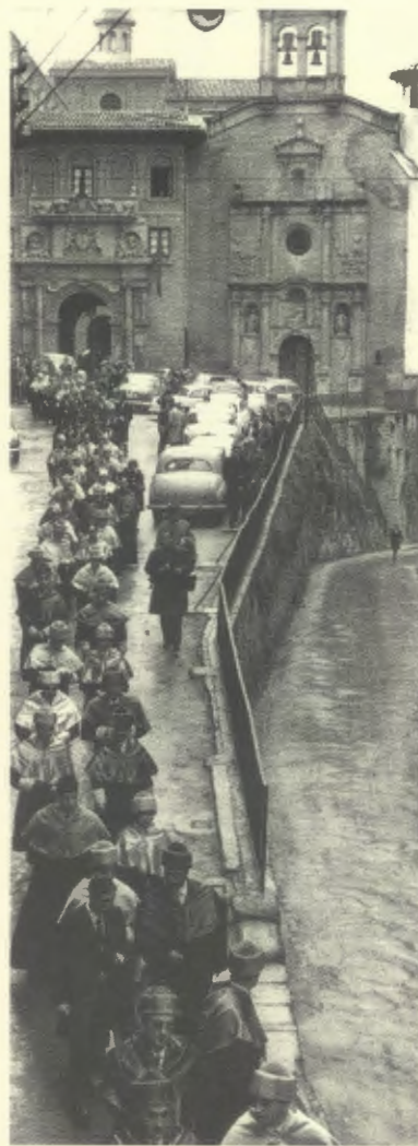
Cortejo académico integrado por los profesores del Estudio General de Navarra y de otras universidades españolas.

Pérez-Embid habla, en su prólogo, de «la presión intelectual de la izquierda burguesa, mantenida por los hombres de la Institución y de la Revista de Occidente», que culminó con el advenimiento de la República.