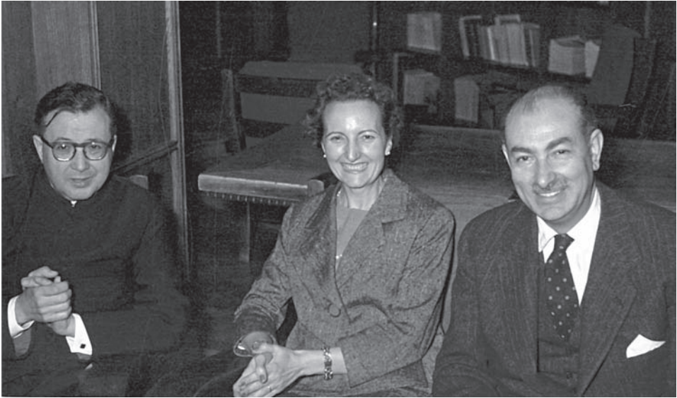
San Josemaría con Mariano Navarro Rubio y su mujer, María Dolores Serrés, con ocasión de un viaje a Roma, en 1958.