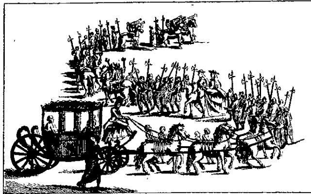
Il Corteo del Cardinale Delegato per l'apertura di una delle tre Porte Sante (Arch. Bib. Vat.)