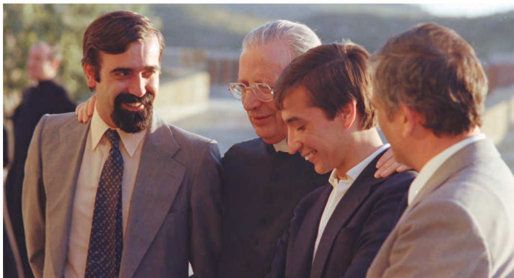
Àlvar del Portillo, a Torreciudad