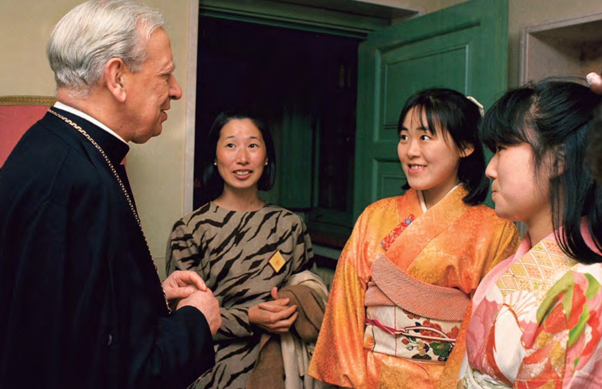
Mons. Álvaro del Portillo, amb unes universitàries

càrrec vostre. Rebel·leu-vos contra els qui volen aprofitar-se de la vostra joventut i de la vostra càrrega ideal, per perpetuar sistemes opressius de la dignitat humana. Rebel·leu-vos contra els qui intenten arrencar Déu de les vostres ments i de les vostres vides, de la vostra família, del vostre lloc d'estudi o treball". 2