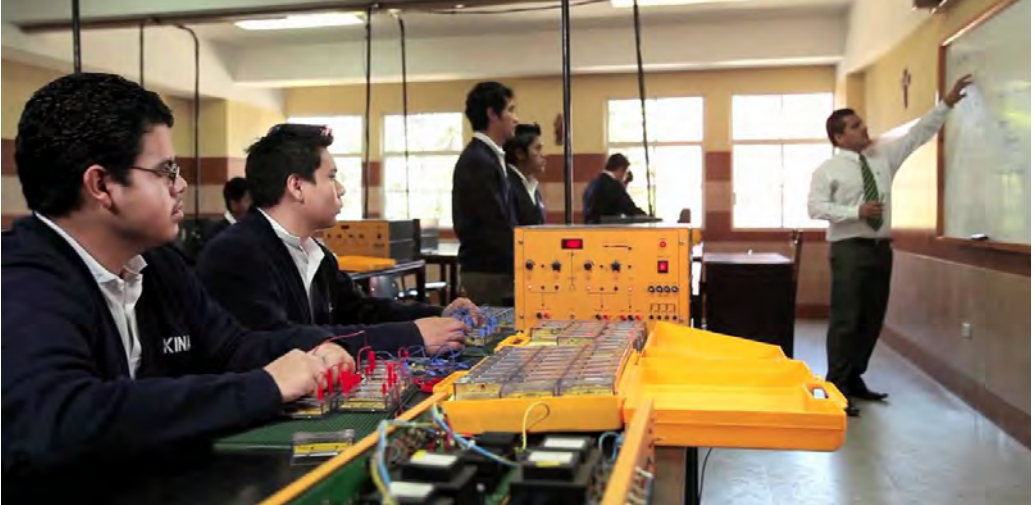
Joves rebent una classe a Kinal

Kinal va iniciar les seves activitats el 1961 amb un grup de paletes i fusters d'un suburbi marginal de Guatemala. El beat Àlvar del Portillo va ser-ne impulsor directe. Actualment, 1.500 joves reben una formació tècnica que els permet aconseguir una feina per tirar endavant la seva família.