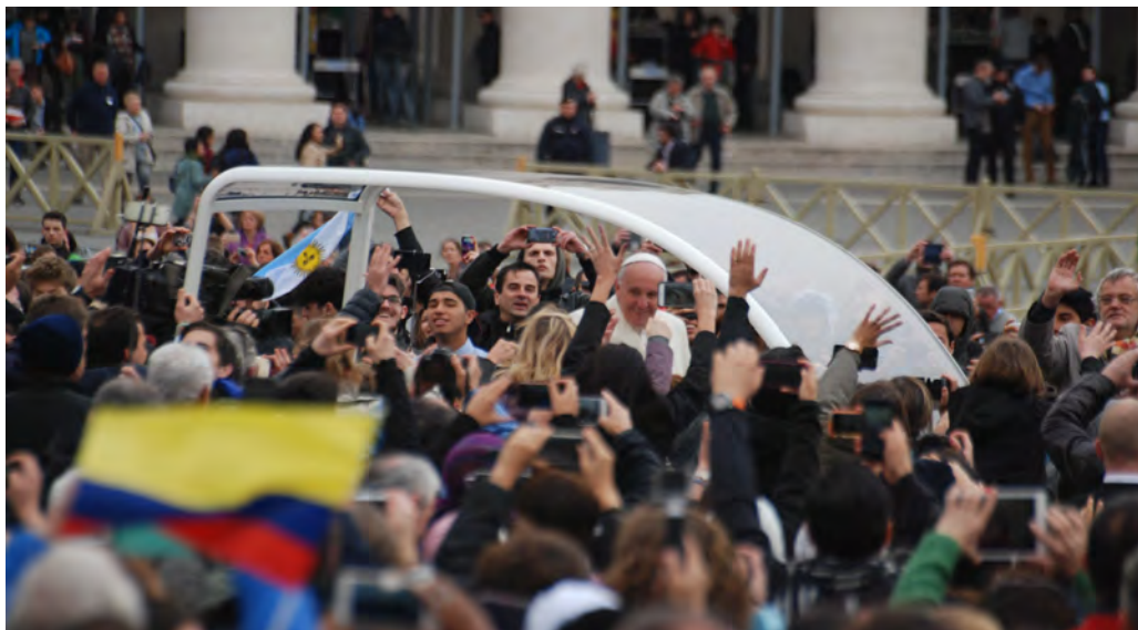
El Papa Francesc, al costat de joves de tot el món abans de l'audiència del passat Congrés Universitari Internacional UNIV'2016.

“Estimats joves, tinc el gust d’anunciar-vos que al més d’octubre de 2018 se celebrarà el Sínode dels Bisbes sobre el tema «els joves, la fe i el discerniment vocacional». He volgut que ocupeu el centre de l’atenció, perquè us porto al cor”. Així comença la carta del Papa Francesc, datada el 13 de gener de 2017, dirigida als joves del món, en la qual expressa una prioritat clara de tota l’Església.