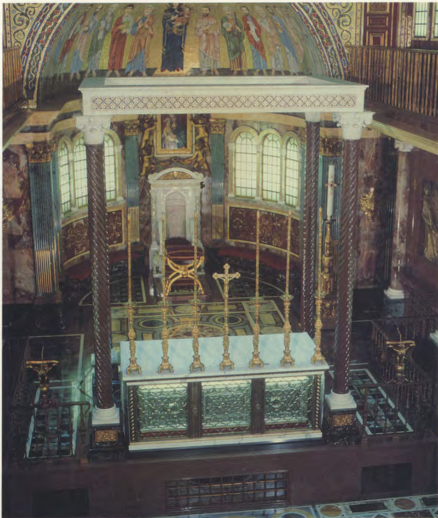
Autel de l'église prélatice de Sainte-Marie de la Paix, avec la châsse du bienheureux Josemaría Escrivá.