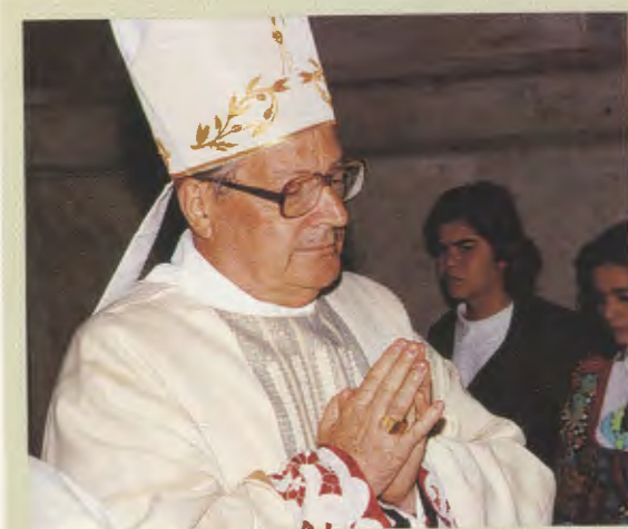
Cardinal Angelo Sodano Secrétaire d'État de Sa Sainteté (Basilique Saint-Paul hors les murs, 20-V-1992)

C'est Pierre qui dirige le bateau pour la pêche miraculeuse. Hier comme aujourd'hui, le Successeur de Pierre est celui qui dirige la barque de l'Église à travers les mers de l'histoire humaine: c'est le Pape qui reçoit de l'Esprit le soutien dans son ministère de confirmer ses frères dans la foi (cf. Lc 22, 32 ). Ce sentiment d'adhésion au Souverain Pontife fut profondément enraciné dans la vie du bienheureux Josemaría (...). La béatification de Monseigneur Escrivá est, mes chers frères et soeurs, un moment propice que Dieu nous offre pour réaffirmer notre don généreux de nous-mêmes à l'annonce et au témoignage apostolique (...).