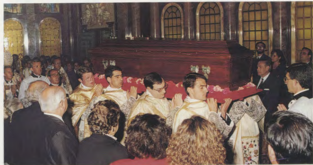
Procession à l'intérieur de l'église prélatice de Sainte-Marie de la Paix, où repose la dépouille du bienheureux Josemaría Escrivá, le 21 mai 1992.

son aide dans les besoins spirituels et matériels qui accompagnent toujours la vie des hommes.