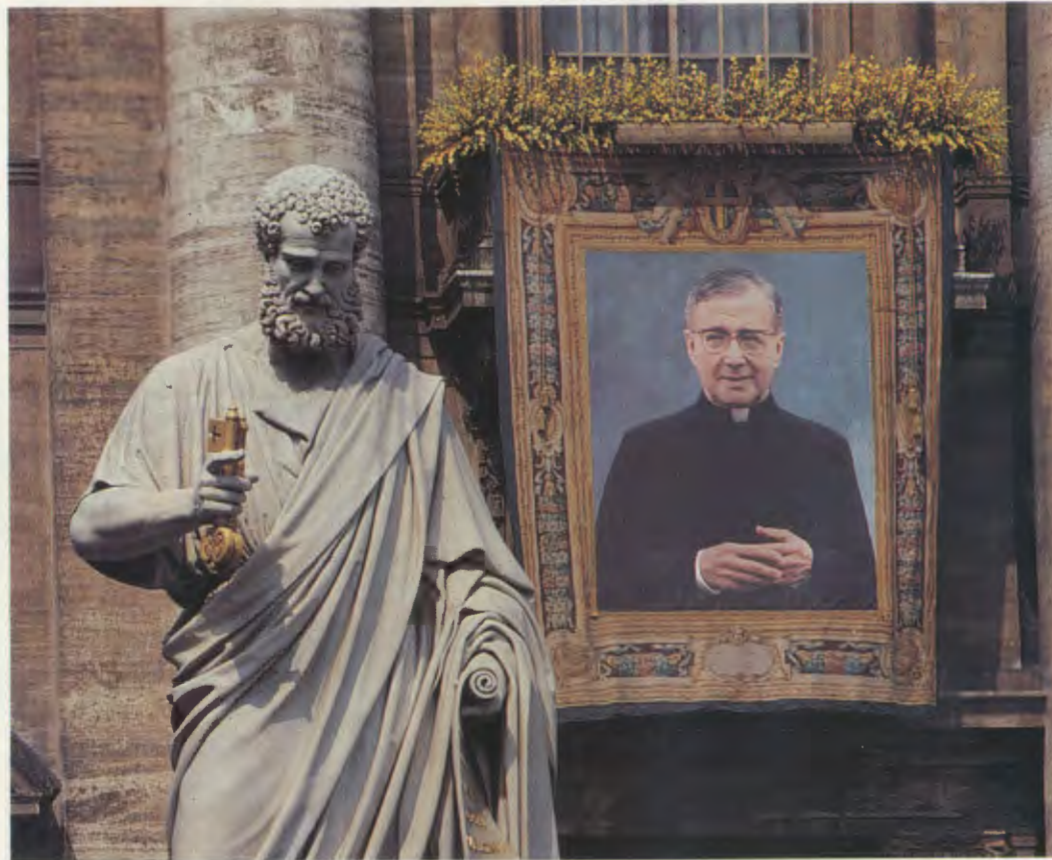
Portrait du bienheureux Josemaría Escrivá, exposé sur la façade de la Basilique Saint-Pierre, le 17 mai —à partir du moment de sa béatification— et le 18 mai.