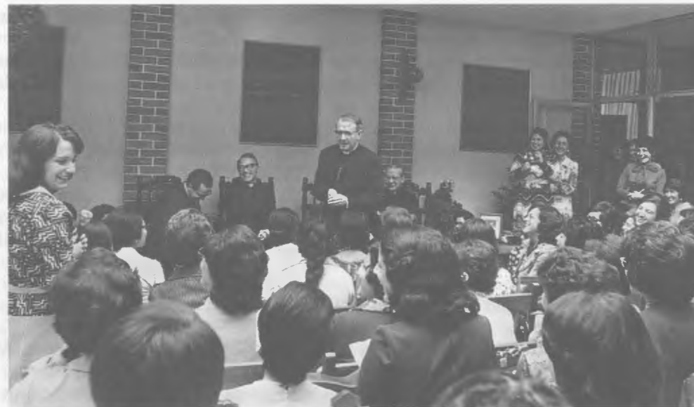
Guatemala, 1975, dans un Centre pour la formation de la femme.

« J'estime que c'est une des grâces de ma vie d'avoir connu Monseigneur Escrivá et d'avoir