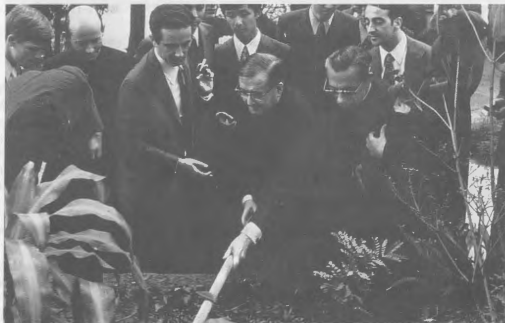
1974, Brésil, Sitio de Aroeira, un centre de l'Opus Dei.

«Tous ceux qui ont eu le privilège de faire sa connaissance peuvent témoigner que, lorsqu'il est mort en 1975, à l'âge de 73 ans, il était encore très jeune. Il n'avait pas vieilli au fil des années. Au contraire, son esprit devenait chaque année plus jeune, ce qui lui donnait une incroyable vitalité de jeunesse et de joie. Tout cela ne venait pas sans effort, mais était précisément le résultat de toute une vie de lutte héroïque qui l'a amené à s'unir chaque jour davantage au Seigneur» ( Opus Dei in Africa: a force for good , dans «Sunday Nation», Nairobi, le 3-II-1980).