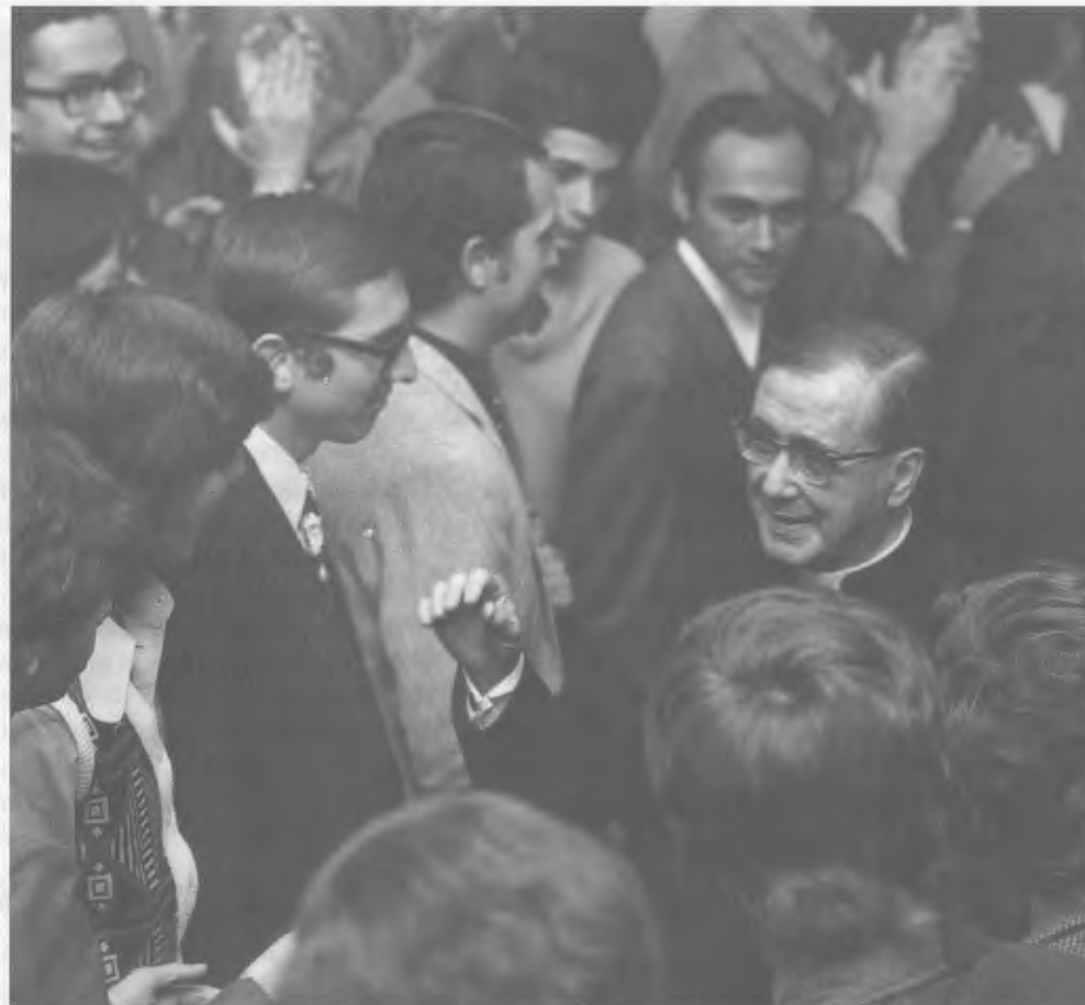
1974, São Paulo (Brésil), à la suite d'une réunion.

Depuis la fondation de l'Opus Dei, il a rendu à l'Église des services insignes, plein d'amour et de persévérance» (AGP, RHF P-00644, Lettre au Saint Père, Osaka le 27-VII-1975).