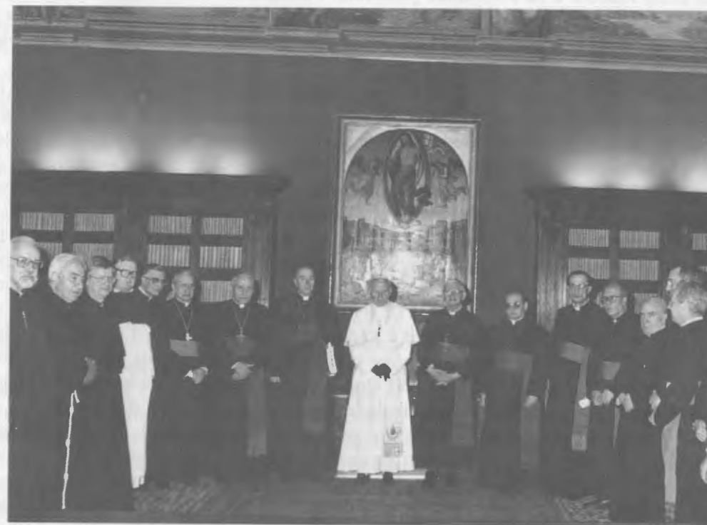
Le 9 avril 1990. Après la lecture du décret sur les vertus héroïques du vénérable Josemaría Escrivá.