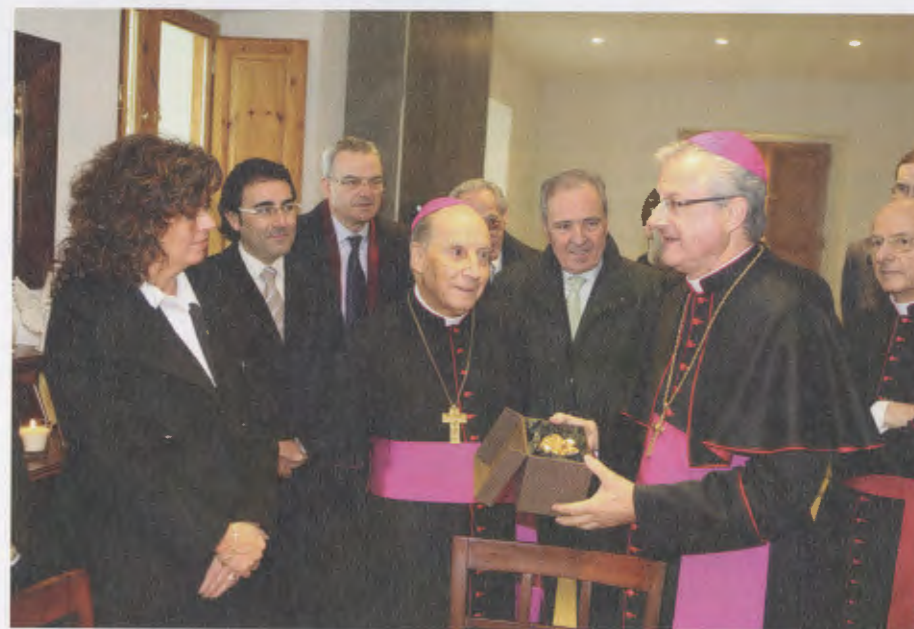
A l'esquerra, mirant l'exposició sobre el pas de sant Josepmaria per Andorra. Inferior: El Prelat obsequià Mons. Vives, copríncep d'Andorra, amb una rèplica de la rosa de Rialp.