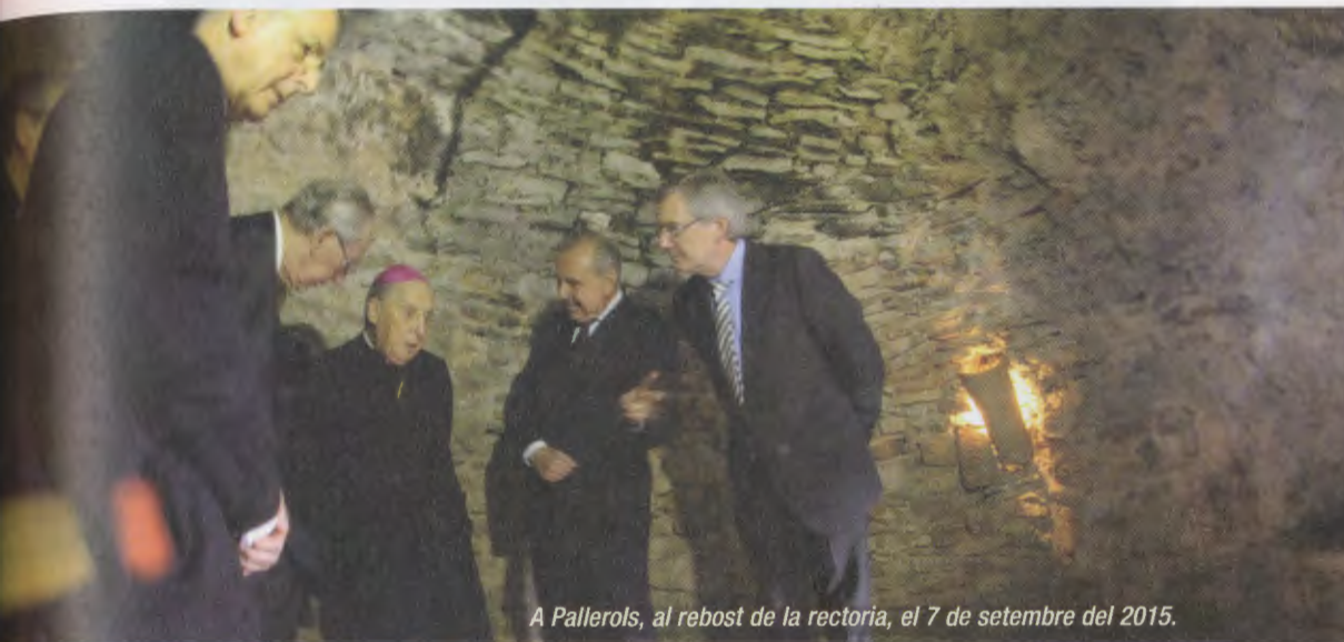
A Pallerols, al rebost de la rectoria, el 7 de setembre del 2015.

Tot el que tenia a veure amb sant Josepmaria era per a Mons. Echevarría una prioritat. Per això va seguir amb interès i emoció les incidències en la recuperació del camí de Pallerols a Andorra.