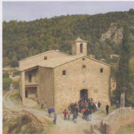
Durant la cerimònia de benedicció de la reconstruïda rectoria de Pallerols.