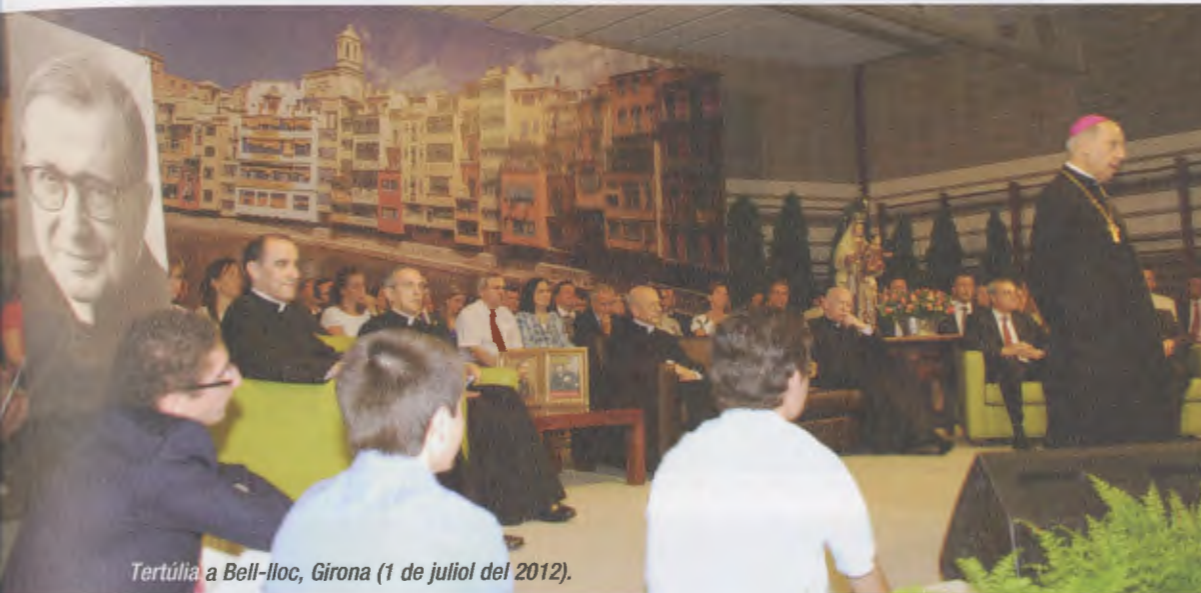
Tertúlia a Bell-lloc, Girona (1 de juliol del 2012).

Mons. Javier Echevarría, que va ser durant vint-i-quatre anys prelat de l'Opus Dei i estret col·laborador del Fundador i del beat Àlvar del Portillo, va tenir una gran vinculació amb Catalunya.