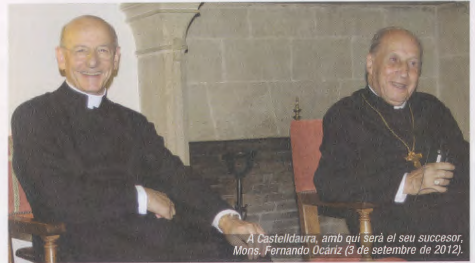
A Castellldaura, amb qui serà el seu successor, Mons. Fernando Ocariz (3 de setembre de 2012).

El diumenge dia 2 al matí té dues tertúlies a l'aula magna de la Universitat Internacional de Catalunya. A les 18:00 h, vola cap a Roma.