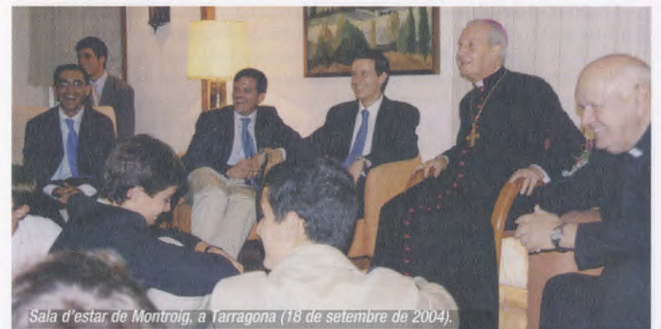
Sala d'estar de Montroig, a Tarragona (18 de setembre de 2004).

El dia 20, després de l'esmorzar, surt en avió cap a Roma.