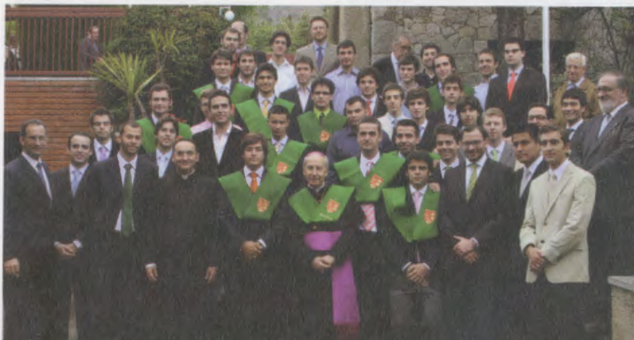
Amb el universitaris residents del Col·legi Major Pedralbes (17 de maig de 2008).

El dia 1 es desplaça a Andorra. Arriba a Sant Julià de Lòria, on el rep l'arquebisbe d'Urgell i copríncep d'Andorra i altres autoritats. A les 12:00 h beneeix l'escultura de sant Josepmaria a l'església de Sant Julià de Lòria. Posteriorment, té lloc una recepció a la Casa de la Vall, on escriu una dedicatòria en el llibre d'honor. Amb diverses autoritats, assisteix a un dinar oficial a l'hotel Andorra Park d'Andorra la Vella. Al final, brindis del Síndic General, del Cap de Govern, l'arquebisbe d'Urgell i, finalment, del Pare. Fa l'oració de la tarda a l'església de Sant Esteve. Participa a la VI Jornada de Camins de Llibertat a través dels Pirineus: El pas de sant Josepmaria per Andorra, l'any 1937 , amb la ponència «Records sobre sant Josepmaria, el pas dels Pirineus i Andorra». Al capvespre, torna a Barcelona.