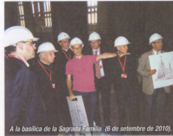
A la basilica de la Sagrada Família (6 de setembre de 2010).

El dia 16 al matí presideix un acte dels 50 anys de l'IESE.