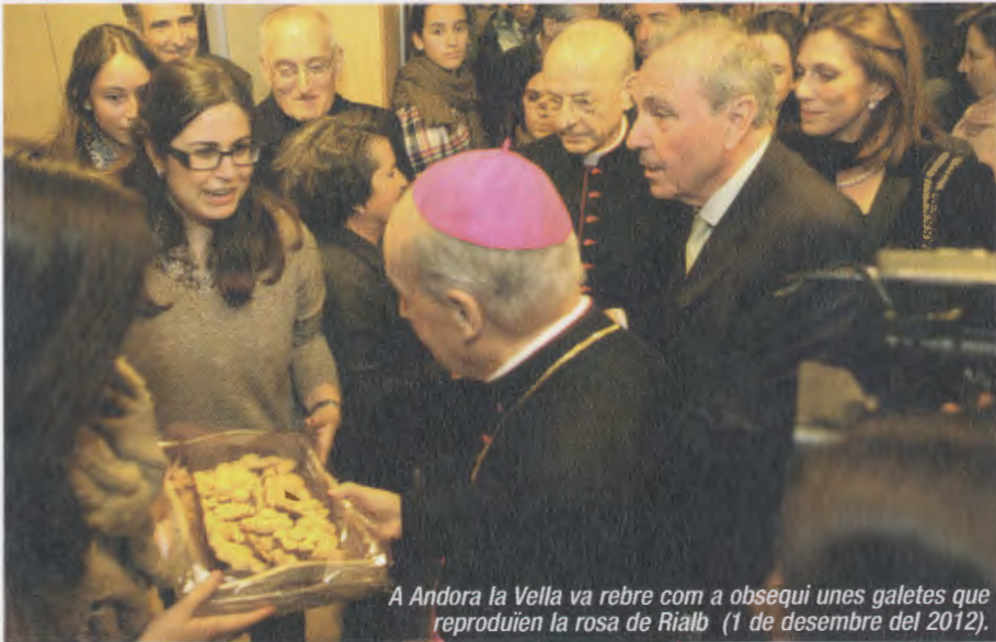
A Andora la Vella va rebre com a obsequi unes galetes que reproduïen la rosa de Rialb (1 de desembre del 2012).

Va continuar: «Els sants, en el seu pas per la terra, deixen un rastre. Els camins que ells han transitat no els hem de considerar com una gesta inimitable o una relíquia per venerar. Déu ha volgut deixar-nos aquestes vides com a exemples propers, perquè ells van veure els mateixos paisatges i van caminar per la mateixa terra que nosaltres veiem i trepitgem cada dia. Considerar els episodis de la seva vida, com estem fent avui, gràcies a l'afecte que teniu per aquest pas de sant Josepmaria per Andorra, ha de servir-nos per imitar els sants en aquelles coses que ens acosten a Déu i als altres. Els pocs dies passats a Andorra per sant Josepmaria contenen moltes lliçons. Els ensenyaments d'un home d'oració, que amb tanta pietat va aprofitar aquesta llibertat de creure i resar que Andorra li va oferir. L'exemple d'un home amant de la llibertat de tots, l'exemple d'un sant que sabia estimar, que sabia perdonar, que sabia agrair.»