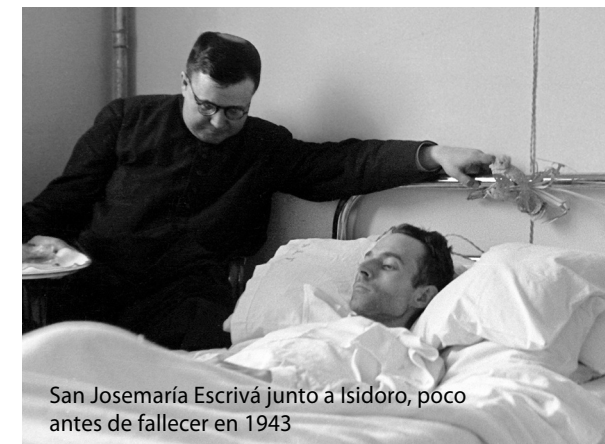
San Josemaría Escrivá junto a Isidoro, poco antes de fallecer en 1943

Durante la Guerra Civil española asistió a muchas personas, proporcionándoles provisiones, alimentos y ayuda espiritual. Contribuyó a mantener unidos con san Josemaría y entre sí a los miembros del Opus Dei. Puso de manifiesto su amor a la Eucaristía: a pesar de las restricciones, proporcionaba a san Josemaría y a otros sacerdotes el pan y el vino para que pudieran celebrar la Misa en la clandestinidad, guardaba las sagradas formas para que comulgaran los refugiados