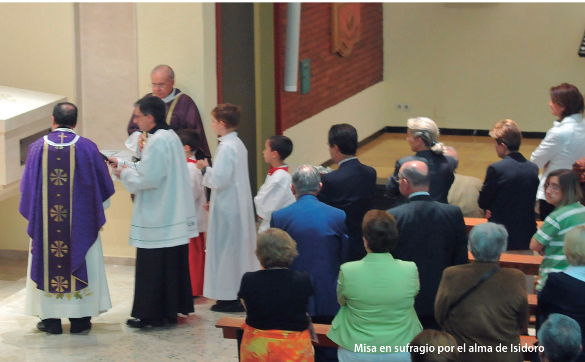
Misa en sufragio por el alma de Isidoro