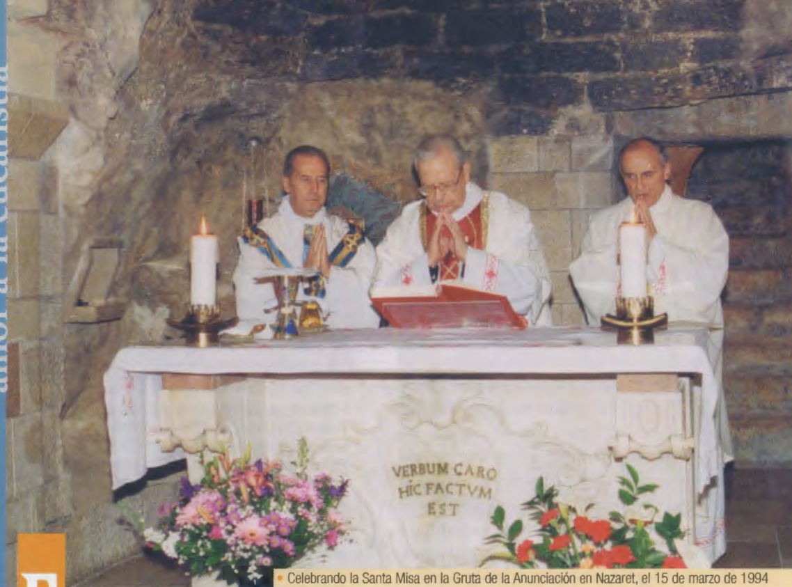
• Celebrando la Santa Misa en la Gruta de la Anunciación en Nazaret, el 15 de marzo de 1994