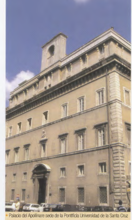
• Palazzo dell'Apollinare sede de la Pontificia Universidad de la Santa Cruz

“Sin su ayuda, grande o pequeña, pero siempre fruto del amor a Dios y de la veneración al sacerdocio, no podría llevarse a cabo todo el bien que se realiza en servicio de la Iglesia”, ha dicho recientemente Mons. Javier Echevarría, Prelado del Opus Dei, a propósito de quienes colaboran económicamente con la Universidad.