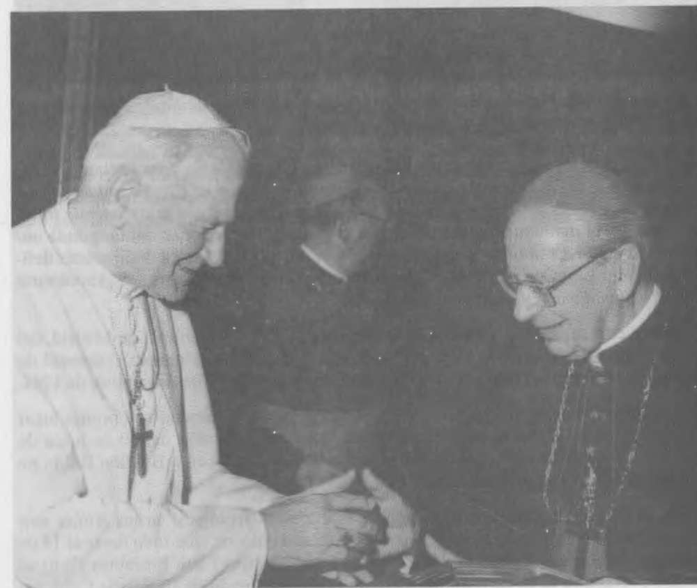
El Santo Padre, S.E.R. Card. Eduardo Martínez Somalo y el Prelado del Opus Dei, S.E.R. Mons. Alvaro del Portillo, el 6 de julio de 1991, después de la lectura del Decreto.