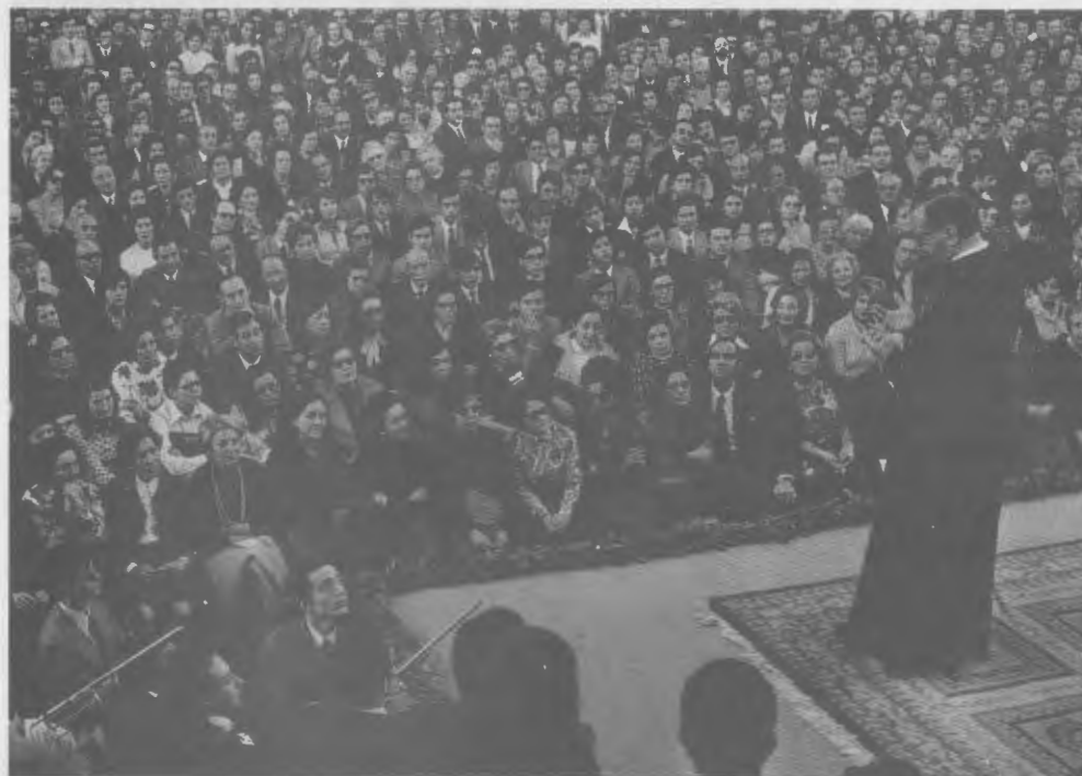
Durante una tertulia en Brafa, Barcelona (España), el 22 de noviembre de 1972.