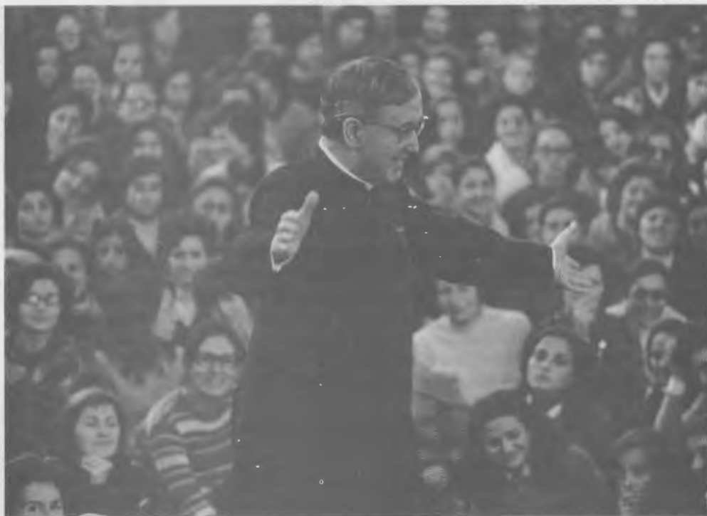
En una tertulia en Brafa, Barcelona (España), el 25 de noviembre de 1972.

contrario, intensificaron sus ruegos. Y, en estrecha concomitancia con sus oraciones, llegó de improviso la curación.