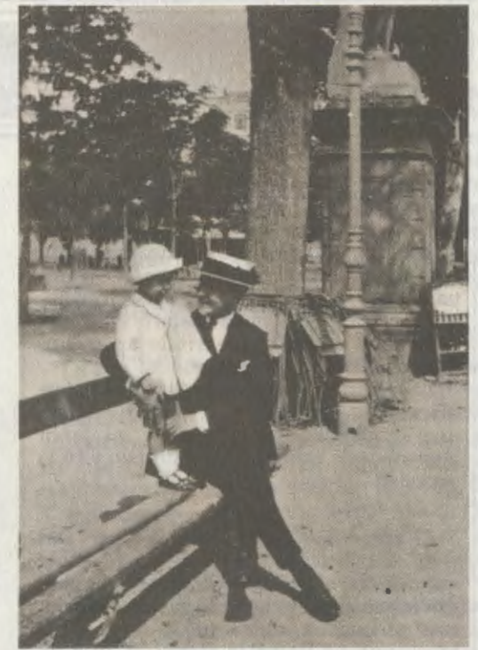
Logroño, mayo de 1921. El Siervo de Dios a la edad de diecinueve años, con su hermano Santiago.

Llega Josemaría al Seminario con el preámbulo de unos estudios de bachillerato brillantes, de una inteligencia notable y