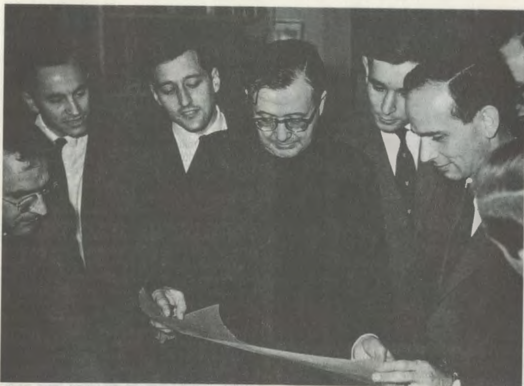
Londres, agosto de 1961. El Siervo de Dios con un grupo de hijos suyos, cuando se preparaba el proyecto para las nuevas construcciones de Netherhall.

amistad y de familia, donde el espíritu cristiano de solidaridad y de cariño mutuo permite superar cualquier diferencia de raza, mentalidad o cultura.