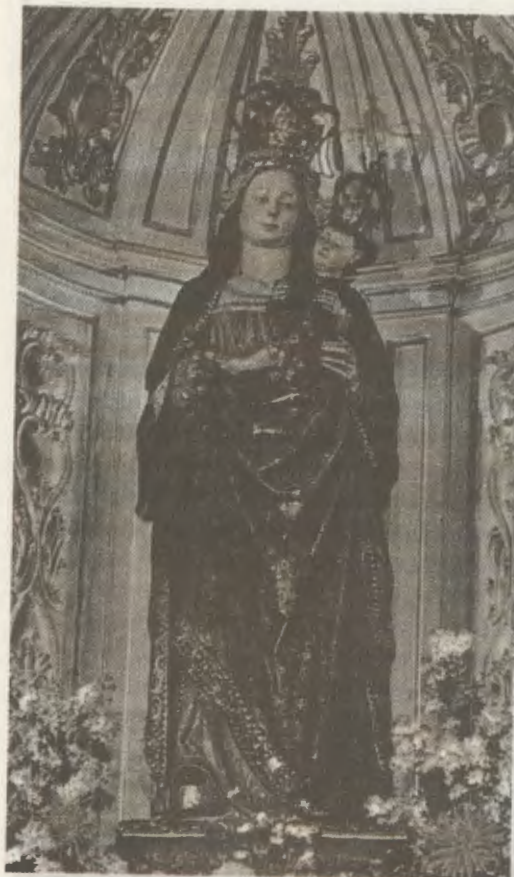
Imagen de Nuestra Señora de los Angeles, que se encuentra en una capilla de Santa María La Redonda, donde acudía con frecuencia a rezar el Siervo de Dios.

La pregunta de este muchacho invita a volver atrás las hojas de la historia. Transcurren los días del período navideño de 1917-1918. La nieve espesa cubre por completo el paisaje de Logroño, capital de la Rioja española. El frío intensísimo destempla la ciudad hasta alcanzar los dieciséis