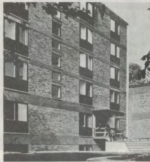
Una vista de Netherhall House.

Netherhall House es una Residencia para universitarios que realizan sus estudios en la Universidad de Londres y en otros Centros de enseñanza superior de la capital británica. Se inauguró en abril de 1952 gracias al impulso de Mons. Escrivá, que desde el principio de la labor apostólica del Opus Dei en el Reino Unido animó a sus hijos a instalar esta Residencia internacional, como medio para contribuir a la formación humana y espiritual de los universitarios. Siempre consideró a Londres como una encrucijada del mundo , donde se encontraban millares de estudiantes de todos los continentes. Y su amor a las