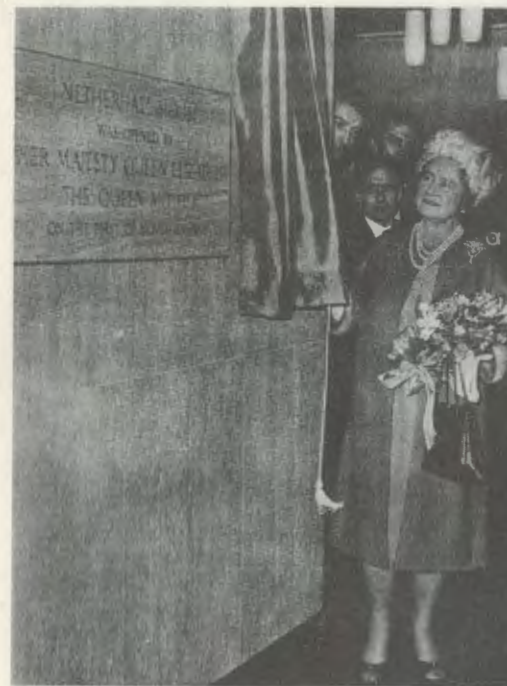
Durante la inauguración de los nuevos edificios de Netherhall por la Reina Madre.

almas le hacía comprender el gran bien que supondría, para la acción evangelizadora de la Iglesia en países lejanos, un servicio como el que se proponía ofrecer en esta Residencia universitaria.