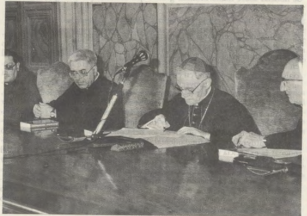
El Cardenal Poletti, Vicario del Papa para la diócesis de Roma, firma las actas de la sesión de clausura del Proceso, como Presidente del Tribunal. Roma, 8 de noviembre de 1986.

Han pasado más de seis años desde que el Vicario de Roma, Cardenal Ugo Poletti, promulgó el Decreto de Introducción de la Causa para la Beatificación y Canonización, el 19 de febrero de 1981. Durante este tiempo, los jueces eclesiásticos han escuchado y recogido las declaraciones de los testigos, en un total de trescientas setenta y cuatro sesiones. El 26 de junio de 1984 concluyó un trabajo paralelo ante el tribunal de la Archidiócesis de Madrid, que escuchó a un gran número de testigos en lengua castellana. También en Madrid concluyeron dos Procesos sobre curaciones de carácter extraordinario, atribuidas a la intercesión de Mons. Escrivá: la desaparición instantánea de una enfermedad tumoral y la curación de un linfoma maligno.