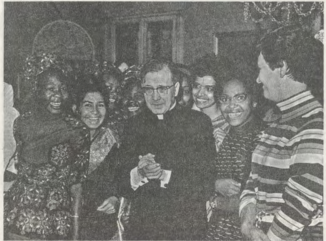
Roma, 10 de abril de 1971. Mons. Escrivá con un grupo de estudiantes, alumnas de Kianda.

En 1958, la labor del Opus Dei se extendió —bajo el impulso de su Fundador— al Extremo Oriente y a África. Dos años después, la Sección de mujeres de la Obra comenzaba su labor en Kenia. En mayo de 1960, las mujeres que marcharían a ese país, procedentes de diversas naciones de Europa y de América, se reunieron unos días en Roma, para recibir la bendición y el aliento espiritual del Siervo de Dios.