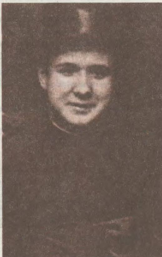
Mons. Josemaría Escrivá de Balaguer, seminarista en Zaragoza, 1923.

Acuden a mi pensamiento tantas manifestaciones del Amor de Dios en aquellos años de mi adolescencia —dirá más tarde evocando aquellos recuerdos—, cuando barruntaba que el Señor quería algo de mí, algo que no sabía lo que era. Sucesos y detalles ordinarios, aparentemente inocentes, de los que El se valía para meter en mi alma esa inquietud divina. Por eso he entendido muy bien aquel amor tan hu-