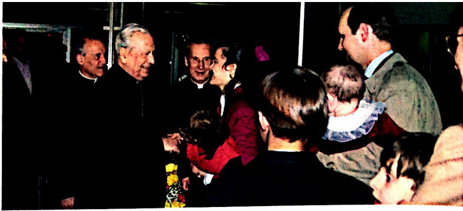
• Roma, 22 de marzo de 1994. Aeropuerto de Ciampino. Última fotografía de Mons. Álvaro del Portillo, tomada pocas horas antes de fallecer. Al bajar del avión, por la noche, a su regreso de Tierra Santa, tuvo la grata sorpresa de encontrarse con varias familias que le esperaban

otra realidad humana— es el ámbito en el cual el hombre es amado por sí mismo y aprende a vivir «el don sincero de sí» (n.11). Esto es, la familia en cuanto escuela de amor: con la condición, sin embargo, de que sepa conservar la propia identidad, la de una comunidad estable de amor entre un hombre y una mujer, basada en el matrimonio y abierta a la vida.