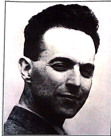
El Siervo de Dios