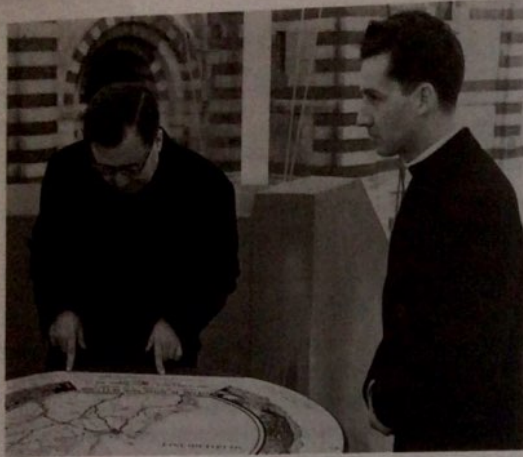
Con D. Javier Echevarría en Marsella delante de Notre-Dame De la Garde, 1958

En estos años de preparación inmediata al Jubileo, el Santo Padre nos impulsa a acercarnos más a Cristo –y, con El, al Espíritu Santo y al Padre–, para renacer con su gracia. El Beato Josemaría expresaba con fuerza la realidad de esa novedad de vida prometida al cristiano: «Renueva tu alegría santa porque, frente al hombre que se desintegra sin Cristo, se alza el hombre que ha resucitado con El» 1 . En sus palabras resuena el eco del grito con el que San Pablo exhortaba a los fieles a la conversión: «Despierta, tú que duermes, álzate de entre los muertos, y Cristo te iluminará» 2 .