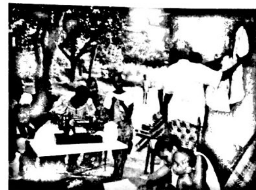
En Eliba, extensión de Monkole situada en otro barrio extremo de Kinshasa, Kindele.

En octubre de 1997, Monkole abrirá también un Instituto Superior de Ciencias de la Enfermería (ISSI), donde se graduarán unas cincuenta alumnas cada año: otra iniciativa que contribuirá a resolver una necesidad patente del sistema sanitario nacional.