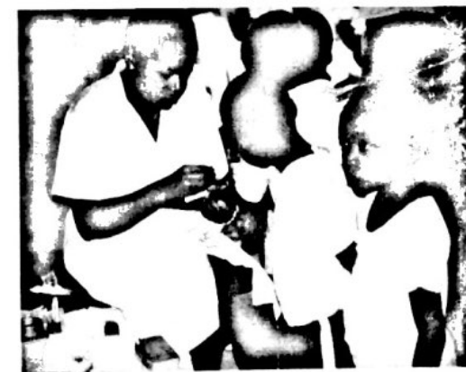
El amor cristiano debe traducirse en obras de servicio.