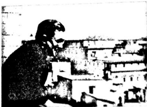
En la terraza del apartamento de Piazza della Città Leonina.