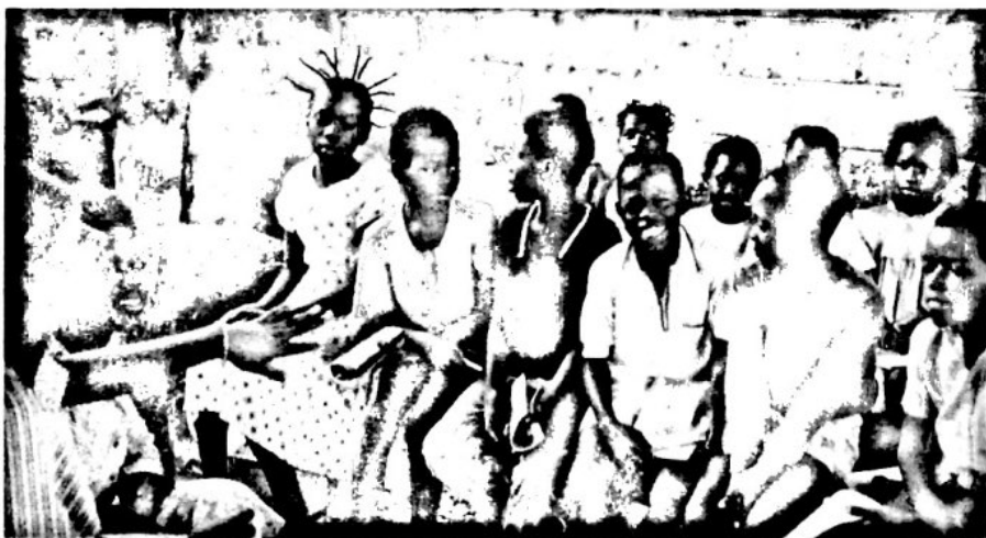
Los objetivos de Eliba son, a la par, médicos y sociales.

Paralelamente, en Monkole se realizan programas de prevención de enfermedades en niños en edad escolar. El personal sanitario del Centro recorre una veintena de unidades escolares, desde las que consigue atender a unos 13.000 alumnos e impartir educación sanitaria a casi 500 profesores.