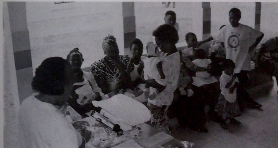
Monkole contribuye a paliar la falta de servicios sanitarios en un barrio periférico de Kinshasa: Mont Ngafula.

Desde el principio, Monkole ha dirigido sus actividades sobre todo a la población más necesitada. La historia del Centro Médico está marcada por la enseñanzas del Beato Josemaría que mostró que el amor cristiano debe traducirse en obras de servicio. Objeto de su predilección fueron especialmente los enfermos, los pobres y los niños,