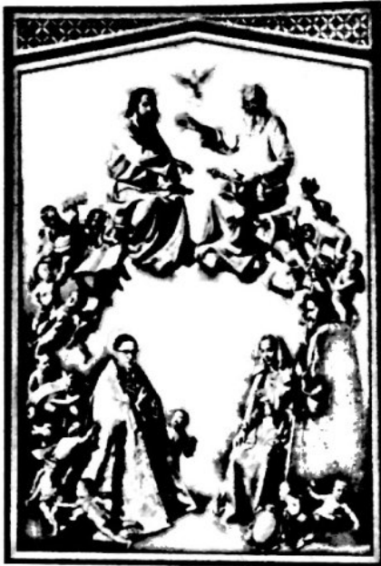
Detalle del retablo. El Beato Josemaría en el Cielo.