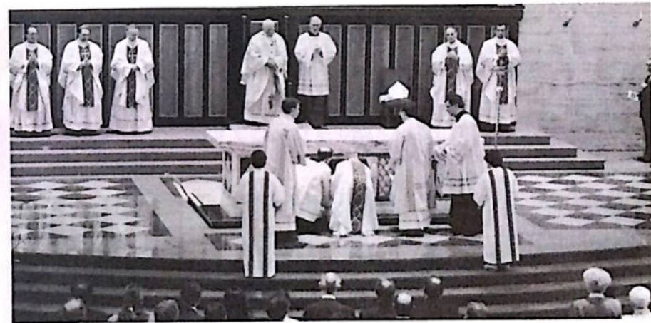
El Prelado del Opus Dei coloca reliquias del Beato Josemaría en el interior del altar, siguiendo una antigua tradición.

El solemne reconocimiento de su ejemplaridad cristiana, proclamada por el Vicario de Cristo y, con él, por la Iglesia entera, suena como una llamada impetuosa a meditar una vez más sobre el sentido último y más profundo de la virtud de la humildad: camino seguro para llegar a Dios. Ocultarme y desaparecer es lo mío: que sólo Jesús se luzca: ésta fue la única ambición del Beato Josemaría, sintetizada, desde sus primerísi-