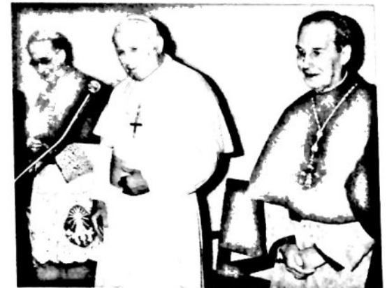
El Santo Padre durante la visita a los locales de la nueva parroquia.