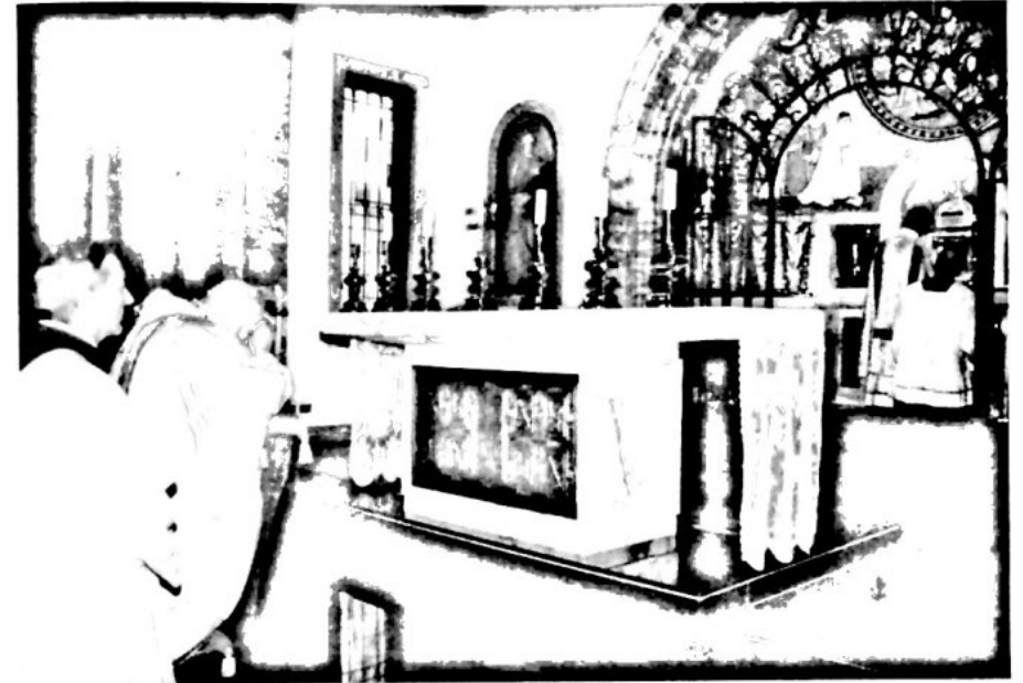
El Santo Padre reza ante el Santísimo Sacramento, mientras se reserva por primera vez en su Capilla.

mayor perfección humana posible, por amor a Dios, en servicio de los hombres y de las mujeres de toda clase y condición social. Porque, como Su Santidad recordó el 17 de mayo de 1992, en la homilía del solemne rito de Beatificación del Fundador del Opus Dei, el trabajo es también medio de santificación personal y de apostolado cuando se vive en unión con Jesucristo, pues el Hijo de Dios, al encarnarse, se ha unido en cierto modo a toda la realidad del hombre y a toda la creación.