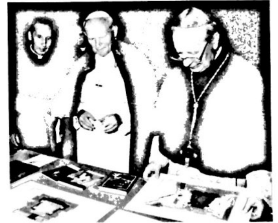
El 17 de mayo de 1992, después de la Beatificación del Fundador del Opus Dei, Mons. Alvaro del Portillo presentó al Santo Padre el proyecto de la futura iglesia del Beato Josemaría.