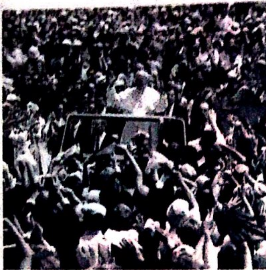
El Santo Padre entre los peregrinos, el 18 de mayo de 1992.

La amplitud con la que el mensaje del Beato Josemaría Escrivá se ha difundido por todos los ambientes de la sociedad manifiesta que su vida y su doctrina ofrecen un eficaz punto de referencia para la nueva evangelización a la que el Santo Padre viene convocando a todos los cristianos. De hecho, esa actualidad del espíritu del Fundador del Opus Dei ha sido puesta de relieve, con insistencia unánime, por muchos representantes de la jerarquía eclesial. Los documentos pontificios de la Causa del Beato Josemaría Escrivá resaltan la fecundidad de sus enseñanzas para toda la Iglesia. En el Breve de beatificación leemos: "Al proclamar la radicalidad de la vocación bautismal abrió nuevos horizontes para una cristianización más profunda de la sociedad (...). Josemaría Escrivá ha mostrado toda la potencia redentora de la fe, su energía transformadora tanto de las personas como de las estructuras en las que se plasman los ideales y las aspiraciones de los hombres".