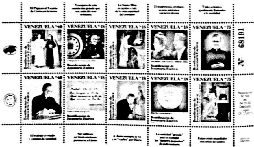
El Instituto Postal Telegráfico de Venezuela emitió una serie de sellos conmemorativos de la beatificación.

Esta petición se enmarca en nuestra intención de cultivar una sincera devoción a los consoladores y amigos del Sagrado Corazón de Jesús. La enseñanza del Beato Josemaría sobre el camino de santificación en el cumplimiento de los deberes ordinarios del cristiano y en el trabajo profesional está enteramente recogida en la espiritualidad y prácticas de nuestra asociación. Admiramos su sólida piedad basada en la