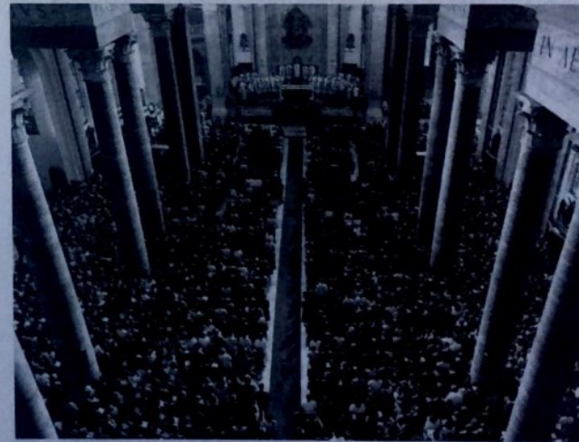
Misa de acción de gracias por la beatificación del Fundador del Opus Dei, celebrada por S.E.R. Mons. Álvaro del Portillo en la Basílica de San Eugenio el 21 de mayo de 1992.

Con motivo de la beatificación han llegado a la Curia prelatia del Opus Dei millares de cartas de felicitación -de miembros de la jerarquía eclesiástica, de sacerdotes, de comunidades religiosas, de fieles corrientes-, donde se manifiesta el convencimiento de que la elevación a los altares del Fundador del Opus Dei ha sido un don providencial para toda la Iglesia. Durante el año transcurrido desde entonces, se ha