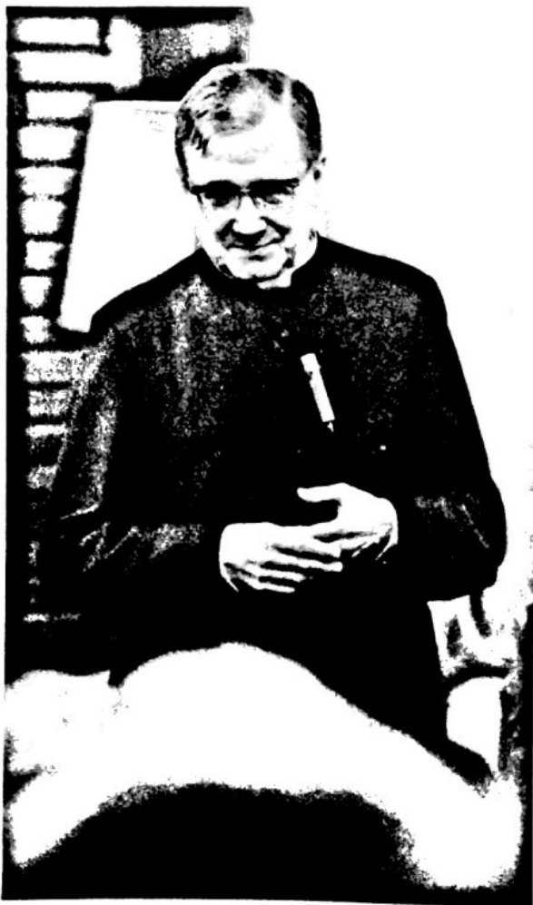
12 Año 1972: El Beato Josemaría en una tertulia.

Iniciativas parecidas han tenido lugar en Yamoussoukro (Costa de Marfil), donde se