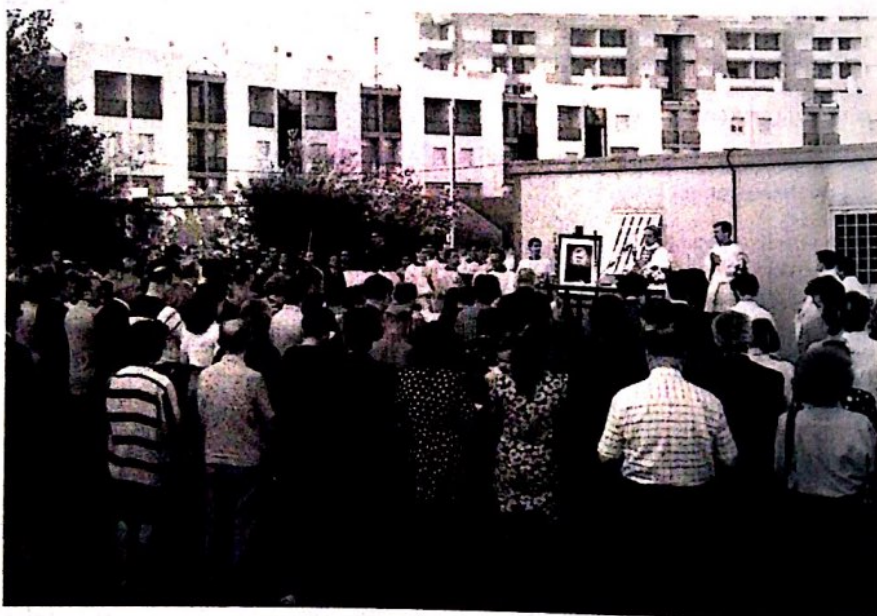
En el lugar donde se levantará la nueva parroquia, se celebra la primera Misa en memoria del Beato Josemaría Escrivá, el 26 de junio de 1993.

* Las personas que estén interesadas en contribuir, pueden hacer llegar sus donativos a la Fundación Fondo de Cooperación y Desarrollo Asistencial Cárdenas-Rosales, c/ Juan Bravo, 48, 7º, 28006 MADRID; teléfono: (91) 402 90 82.