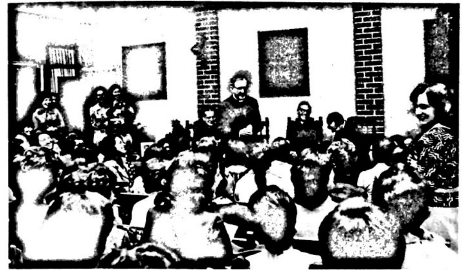
Guatemala, 1975, en un Centro para la formación de la mujer.

«El Dr. Escrivá es un sacerdote modelo, escogido por Dios para santificación de muchas almas, humilde, prudente, abnegado, dócil en extremo a su Prelado, de