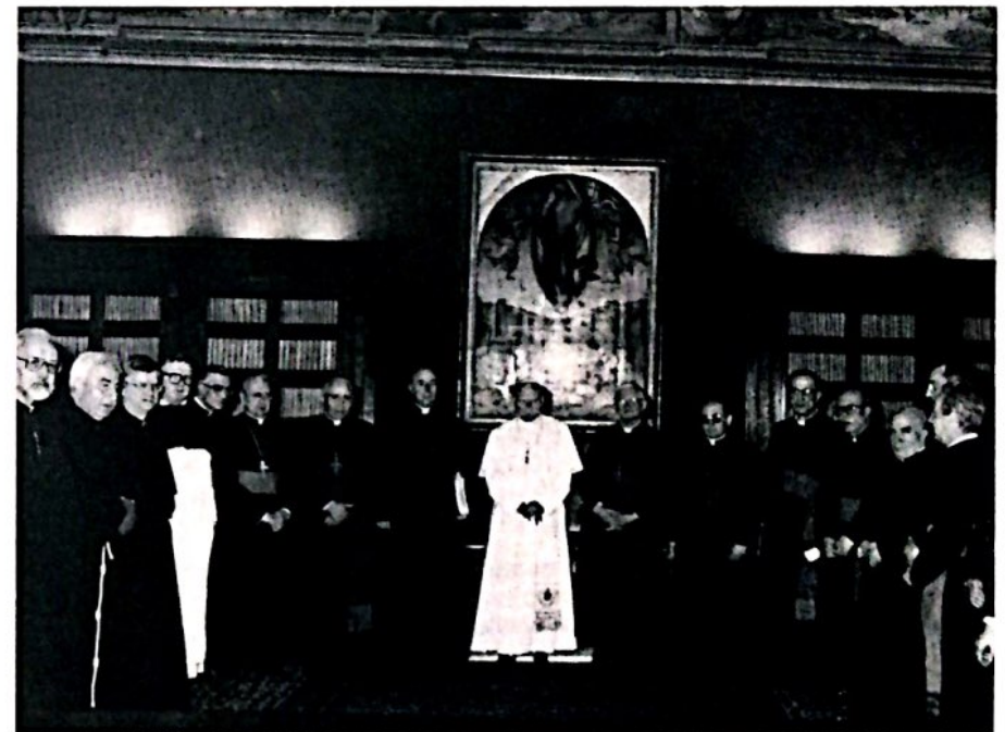
9 de abril de 1990. Después de la lectura del Decreto de virtudes heroicas del Venerable Josemaría Escrivá.

Regnare Christum volumus! , ésta ha sido la gran aspiración del Siervo de Dios, que también puede describirse así: Poner a Cristo en la cumbre de todas las actividades humanas. El servicio eclesial de Josemaría Escrivá ha suscitado un impulso ascendente hacia Dios en hombres inmersos en las realidades temporales, de todos los ambientes y profesiones, de acuerdo con aquellas palabras del Señor