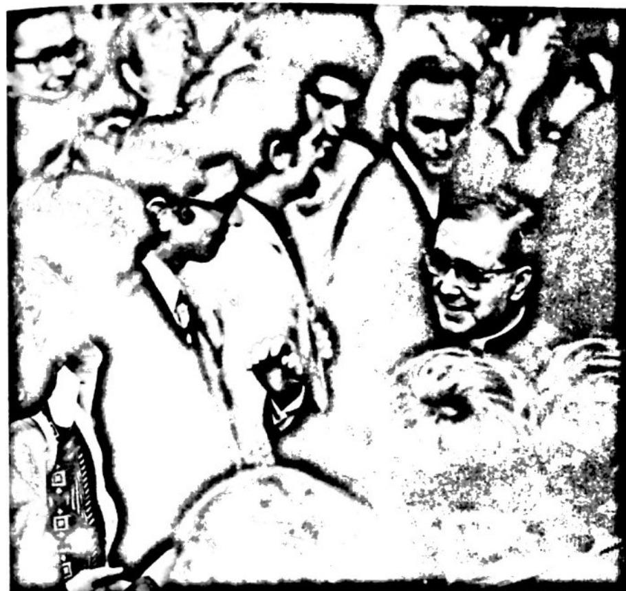
1974, São Paulo (Brasil).

«He tenido la posibilidad de hablar personalmente con él, con calma [...]. Su grandeza de carácter y su fe sobrenatural brillaban en la firmeza de sus convicciones y en una honda caridad con Dios y con los hombres [...].