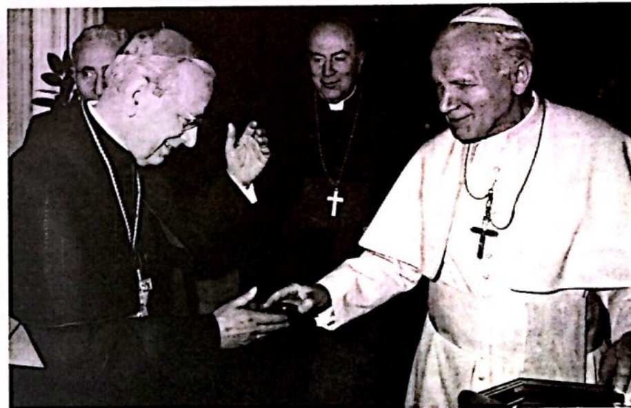
El Santo Padre, el Prefecto de la Congregación para las Causas de los Santos, Cardenal Felici, y el Prelado del Opus Dei Mons. del Portillo el 9 de abril de 1990, después de la declaración de las virtudes heroicas del Venerable Josemaría Escrivá.

En 1946, Josemaría Escrivá fijó su domicilio en Roma: en 1947 y 1950, obtuvo la aprobación del Opus Dei como institución de derecho pontificio. Con una caridad infatigable y una activa esperanza, promovió y guió la expansión del Opus Dei por todo el mundo, contribuyendo a una vasta movilización de laicos, que fueran conscientes de su responsabilidad de participar en la misión de la Iglesia. Impulsó iniciativas de vanguardia en el ámbito de la evangelización y de la promoción humana; suscitó en todas partes vocaciones al sacerdocio y al estado religioso; emprendió viajes extenuantes por Europa y por América, para difundir la doctrina de la Iglesia. Y, sobre todo, se dedicó a la formación de los miembros del Opus Dei — sacerdotes y