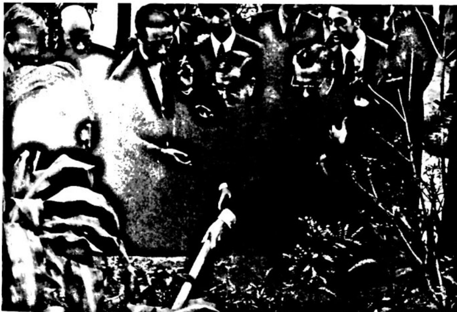
1974, Brasil, Sitio de Aroeira.

«Todos los que tuvieron el privilegio de conocerle pueden atestiguar que, cuando falleció en 1975, a los 73 años, era todavía muy joven. No había envejecido con el paso del tiempo. Al revés, su espíritu se hizo, año tras año, cada vez más joven, con una increíble vitalidad de juventud y de alegría. Todo esto, no nacía sin esfuerzo, sino precisamente como fruto de toda una vida de lucha heroica que le llevó a unirse cada día más con el Señor» ( Opus Dei in Africa: a force for good , en «Sunday Nation», Nairobi 3-II-1980).