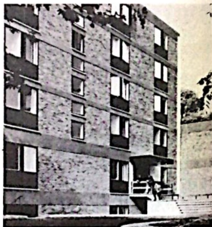
Una vista de Netherhall House.

Netherhall House es una Residencia para universitarios que realizan sus estudios en la Universidad de Londres y en otros Centros de enseñanza superior de la capital británica. Se inauguró en abril de 1952 gracias al impulso de Mons. Escrivá, que desde el principio de la labor apostólica del Opus Dei en el Reino Unido animó a sus hijos a instalar esta Residencia internacional, como medio para contribuir a la formación humana y espiritual de los universitarios. Siempre consideró a Londres como una encrucijada del mundo , donde se encontraban millares de estudiantes de todos los continentes. Y su amor a las