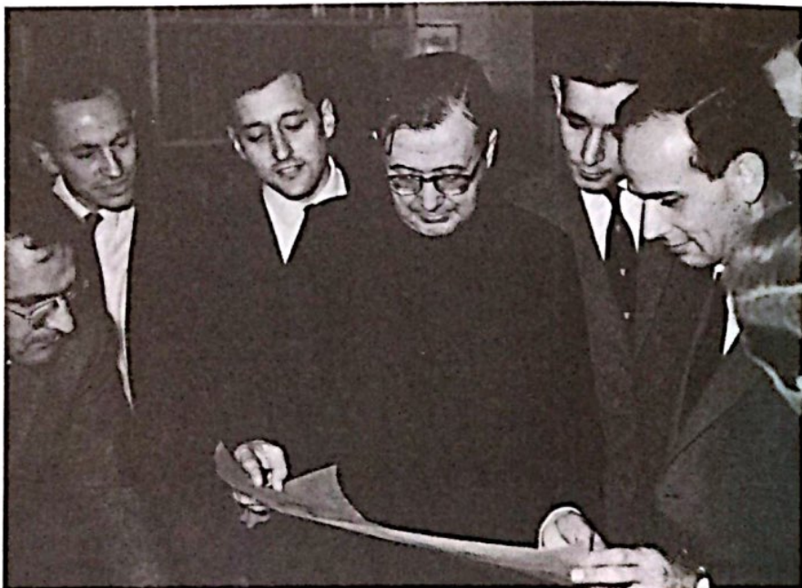
Londres, agosto de 1961. El Siervo de Dios con un grupo de hijos suyos, cuando se preparaba el proyecto para las nuevas construcciones de Netherhall.

amistad y de familia, donde el espíritu cristiano de solidaridad y de cariño mutuo permite superar cualquier diferencia de raza, mentalidad o cultura.