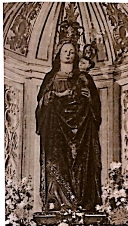
Imagen de Nuestra Señora de los Angeles, que se encuentra en una capilla de Santa María La Redonda, donde acudía con frecuencia a rezar el Siervo de Dios.

La pregunta de este muchacho invita a volver atrás las hojas de la historia. Transcurren los días del período navideño de 1917-1918. La nieve espesa cubre por completo el paisaje de Logroño, capital de la Rioja española. El frío intensísimo destempla la ciudad hasta alcanzar los dieciséis