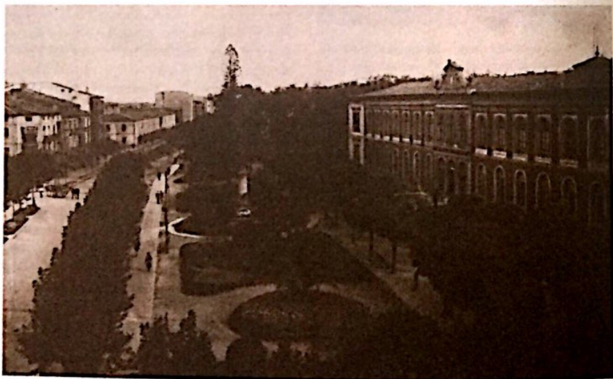
Instituto de Enseñanza Media de Logroño, donde el Siervo de Dios estudió los últimos cursos de Bachillerato.