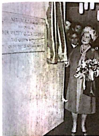
Durante la inauguración de los nuevos edificios de Netherhall por la Reina Madre.

almas le hacía comprender el gran bien que supondría, para la acción evangelizadora de la Iglesia en países lejanos, un servicio como el que se proponía ofrecer en esta Residencia universitaria.