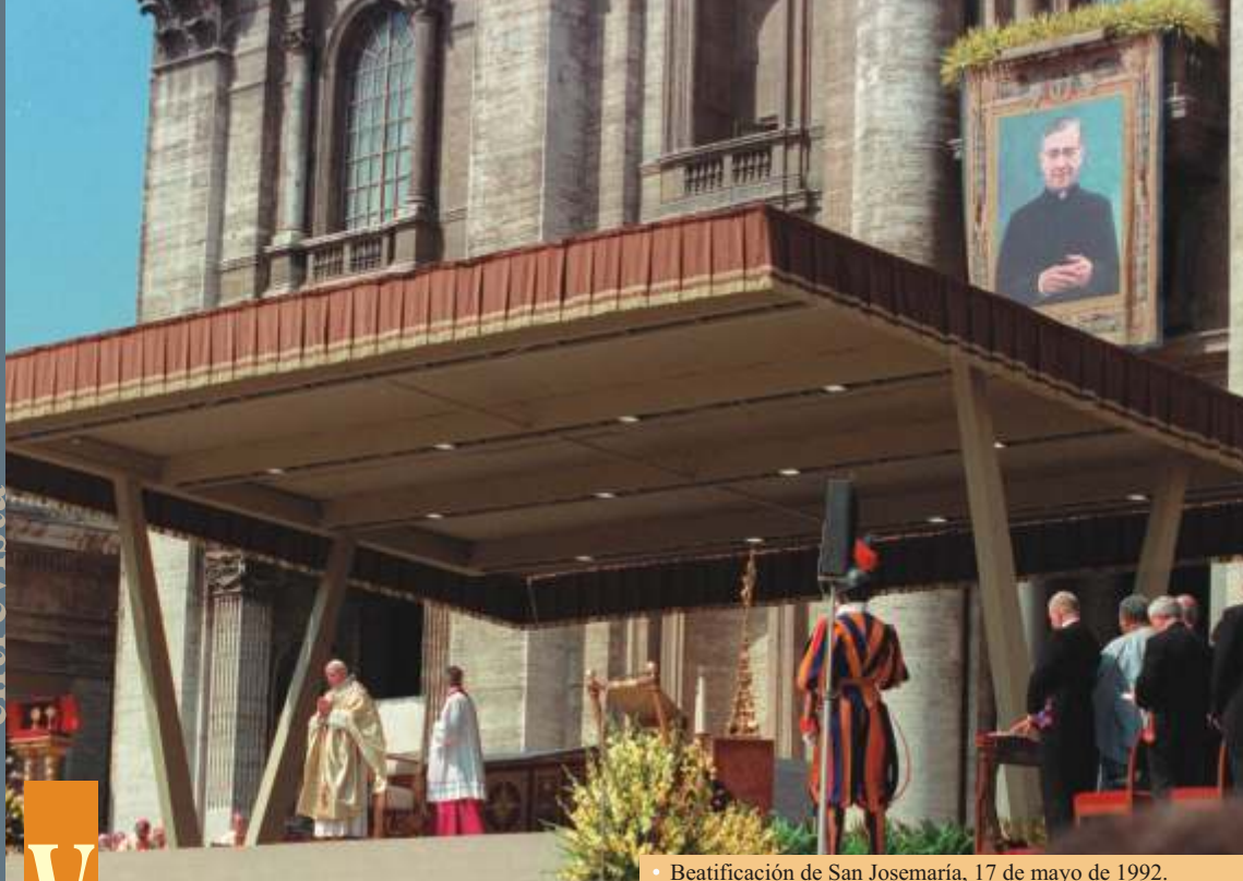
• Beatificación de San Josemaría, 17 de mayo de 1992.