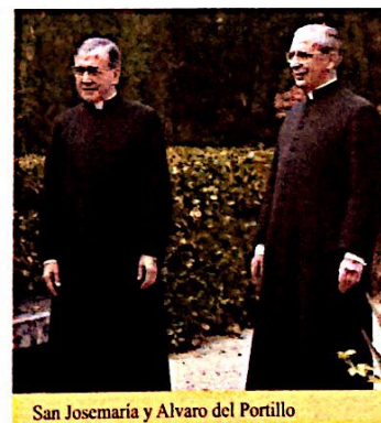
San Josemaría y Alvaro del Portillo

Al alcance de su vista estaban las ventanas, todavía iluminadas de los aposentos pontificios. La imaginación excitaba dentro de su pecho aquel hondo afecto, que también grabó en Camino : "Gracias, Dios mío, por el amor al Papa que has puesto en mi corazón".