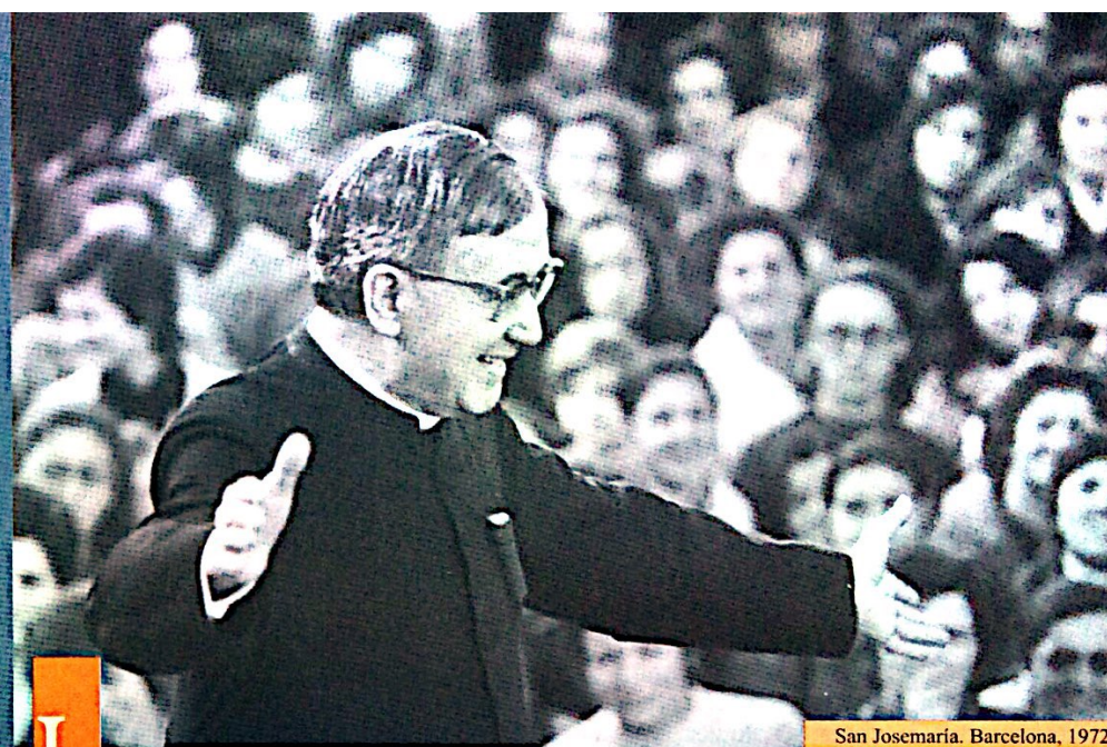
San Josemaría. Barcelona, 1972

A quienes obtengan gracias por intercesión de San Josemaría Escrivá, que las comuniquen a la Prelatura del Opus Dei, Oficina para las Causas de los Santos. Av. Luis P. Ponce 1325. CP. 11300. Montevideo.