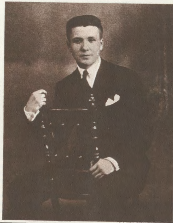
Josemaría aos 19 anos.

De Roma, Mons. Escrivá estimulou e guiou a difusão do Opus Dei por todo o mundo, despendendo todas as suas energias para dar às suas filhas e aos seus filhos uma sólida formação doutrinal, ascética e apostólica. De-