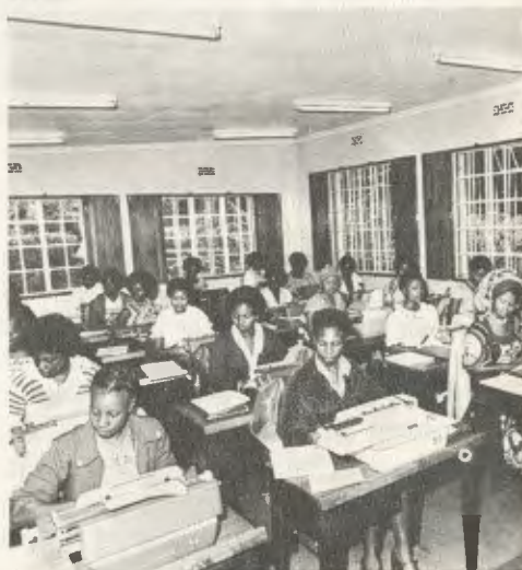
Aula de datilografia no Kianda College.

Assim respondia Mons. Escrivá, em 1966, às perguntas de um jornalista. E o desenvolvimento da Obra em países dos cinco continentes é a melhor demonstração da exatidão dessas palavras.