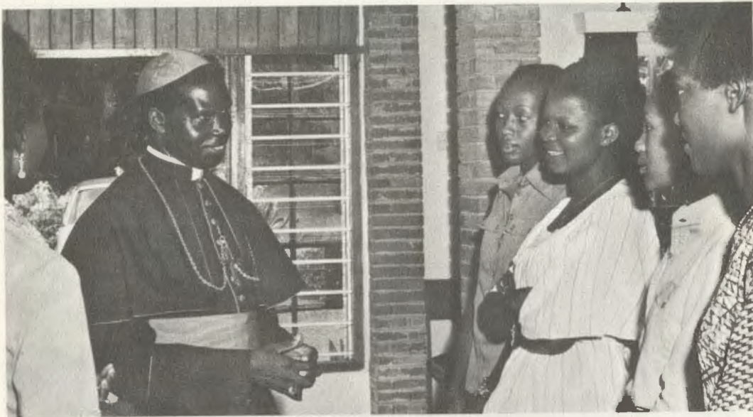
O Cardeal Maurice Otunga, Arcebispo de Nairobi, no Kianda College.

Algumas cifras ilustram o rápido desenvolvimento do Kianda College. Em 1963 havia já alunas dos três países da África Oriental e, a partir de 1967, de muitos outros países do Continente africano: Nigéria, Etiópia, Zâmbia, Ghana, Lesotho... Nesse mesmo ano, abria-se uma Residência para cem moças, e numa ala do novo edifício começou a Kibondeni School, uma Escola de hotelaria. Em 1973, também sob o impulso direto de Mons. Escrivá, que não chegou a vê-la realizada, puseram-se as bases da Kianda High School, um colégio de grau médio, que atualmente tem 350 alunas. Desde o princípio, esta iniciativa contou com o apoio entusiasta das três mil antigas alunas do Kianda College, desejosas de que suas filhas se educassem no mesmo ambiente que elas tinham conhecido.