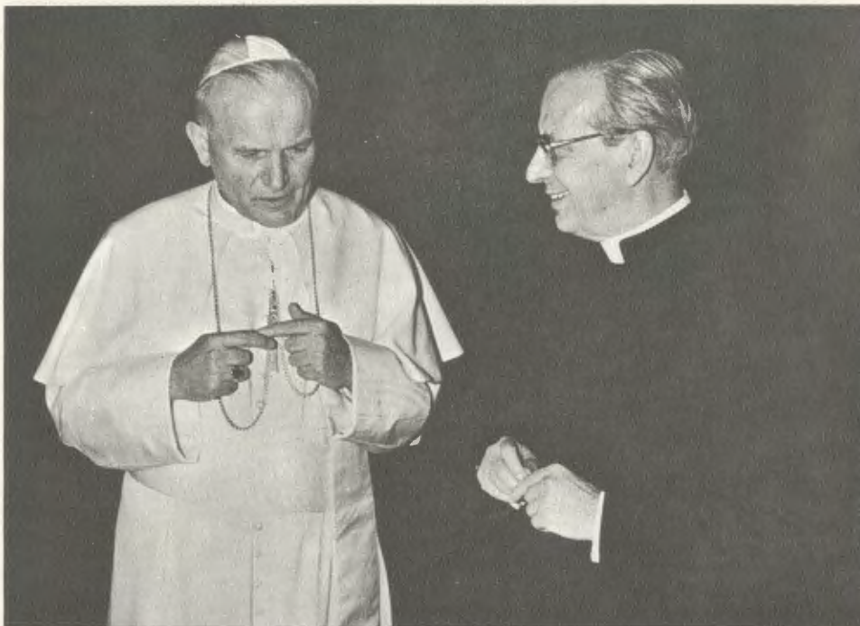
No dia 5 de fevereiro de 1981, Sua Santidade o Papa João Paulo II ratificou o Nihil obstat da Sagrada Congregação para as Causas dos Santos, para a introdução da Causa de Beatificação e Canonização do Servo de Deus Josemaría Escrivá de Balaguer.

Respeitou escrupulosamente as legítimas opções de todos os cristãos em matérias opináveis. Defendeu assim uma característica irrenunciável da vocação secular cristã e salvaguardou a finalidade exclusivamente espiritual do Opus Dei.