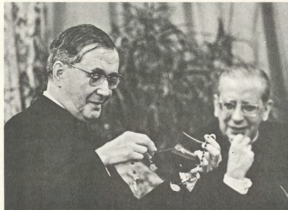
Com o Pe. Álvaro del Portillo, em Lima (Peru), em 25 de julho de 1974.

Em consonância com esta unidade de vida, o Servo de Deus não considerou o apostolado como mais uma atividade a acrescentar às outras,