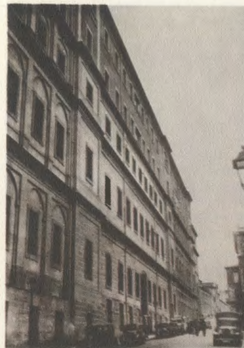
Fachada do antigo Hospital Geral de Madrid, nos anos trinta. Divisa-se ao fundo a igreja do Patronato de Santa Isabel, de que foi Reitor o Servo de Deus.

Por um longo período de tempo, durante muitas tardes, passava pelo Hospital Geral com grupos de rapazes, de sacerdotes, de artesãos, etc. O serviço exigia delicadeza e abnegação. As