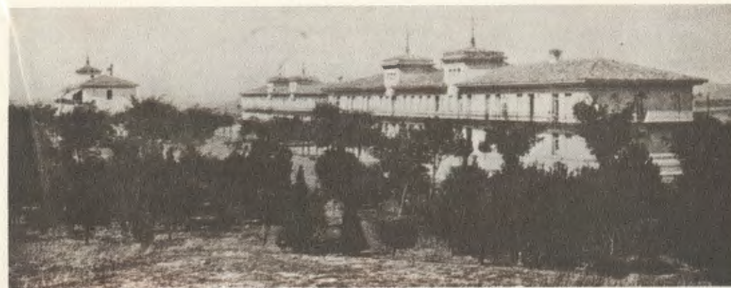
Hospital del Rey (Madrid), depois da sua inauguração em 1925.

Também freqüentou o Hospital del Rey que, naqueles anos da segunda República espanhola, se chamava Hospital Nacional. Era possivelmente o hospital mais moderno de Madrid, e destinava-se aos que tinham doenças infecciosas. Era grande o número de pessoas que sofriam de tuberculose, uma doença incurável na época. Uma Filha da Caridade guarda na memória a imagem de Mons. Escrivá: “Ainda me lembro nitidamente de quando D. Josemaría nos falava de Deus, a propósito de qualquer coisa (...), e dizia o mesmo aos doentes (...). Recordo-me de algumas doentes ainda jovens, tuberculosas, que recuperavam inclusive a alegria humana, embora soubessem que estavam para morrer (...). Com-