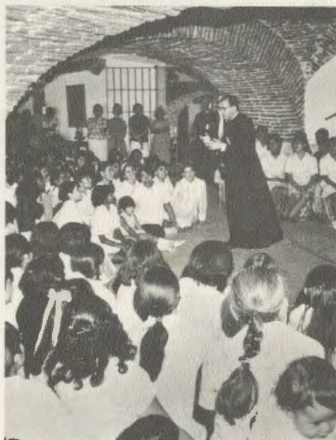
Mons. Josemaría Escrivá fala a um grupo de camponesas da Granja-Escola de Montefalco, em junho de 1970.

Depois de percorrer uma centena de quilômetros por uma estrada asfaltada que partia da cidade do México, atravessamos o vale de Amilpas, no Estado de Morelos, por um caminho de