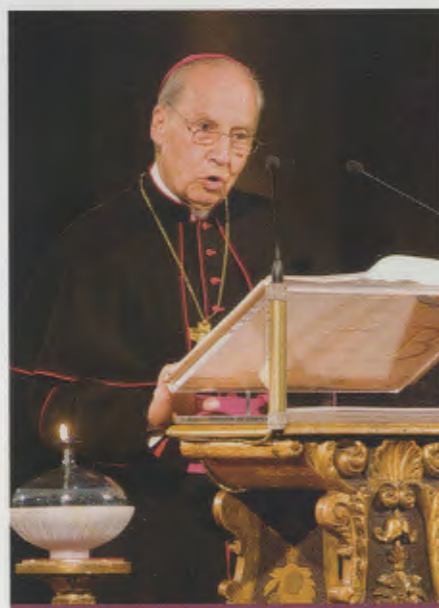
Monseñor Javier Echevarría (1932-2016).

Como prelado, priorizó la evangelización en la familia, la juventud y la cultura. Promovió el inicio estable de las actividades formativas de la prelatura en 16 países,