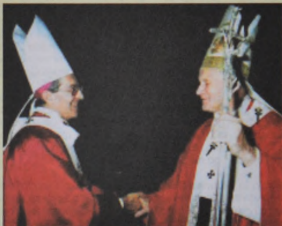
Mons. Juan Larrea saluda al Papa Juan Pablo II en una visita a Roma

Estuve cerca de él, con mayor o menor intensidad en el trato, durante cuarenta