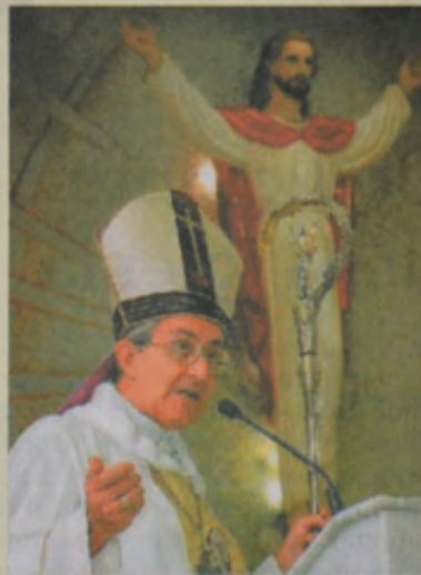
Incansable predicador de la palabra de Dios

Mons. Larrea descansa en paz en la Cripta que se encuentra en la Catedral de Guayaquil. Muchos fieles devotos se acercan diariamente a rezarle y pedir su intercesión poderosa ante Dios