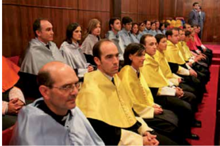
Un momento de un acto de investidura

Una antropología trascendental para la educación. (La acción educativa según el pensamiento de Leonardo Polo). Facultad de Filosofía.