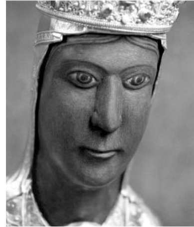
Imagen de la Virgen Negra de Torreciudad (s. XI).

En esta comunicación voy a tratar sobre el santuario de Torreciudad (Huesca, España), inaugurado en julio de 1975. La belleza del paisaje, de la construcción o de la escultura, la limpieza del recinto y lo cuidado de la liturgia, así como la música del órgano, impresionan hondamente al visitante y al peregrino. Todo esto contribuye a que muchos visitantes se conviertan en peregrinos y acaben teniendo una experiencia personal de Dios.