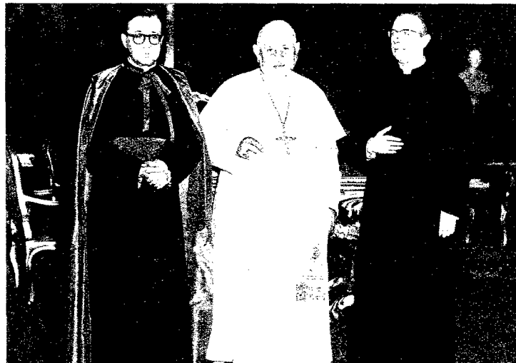
Audiencia privada concedida por el Papa Juan XXIII al fundador del Opus Dei. Acompaña a monseñor Escrivá el secretario general, don Alvaro del Portillo.