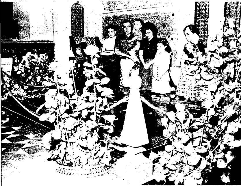
Desde el día de su muerte, centenares de personas, como esta familia, desfilan y rezan jornada tras jornada, ante la tumba del inolvidable sacerdote que fue Monseñor José María Escrivá de Balaguer.

al Papa, a los obispos, a los sacerdotes, al Magisterio eclesiástico, al culto litúrgico y a la devoción privada, y desde ahí a los hombres de toda condición porque para ellos era esa Iglesia tan amada, y mal podía ser querida ésta si no lo eran a la vez todos los que, dentro o fuera del redil, eran, en la intención del Salvador, beneficiarios de sus dones. Esto es amor a la Iglesia, quererla tal como es en sí, sin echar agua al vino, y quererla para todos.