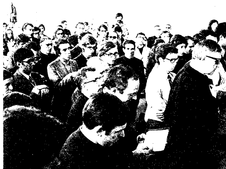
El 2 de noviembre de 1972 don José María Escrivá de Balaguer visitó Fátima. Un grupo de asociados portugueses del Opus Dei le acompañaron allí en oración.