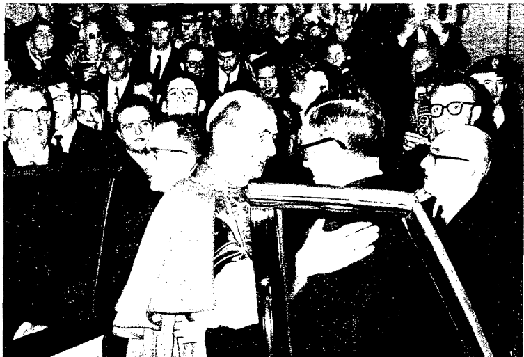
El Papa Pablo VI abraza a monseñor Escrivá de Balaguer tras la inauguración, en noviembre del 65, del centro Elis, situado en la barriada obrera romana del Tiburtino.