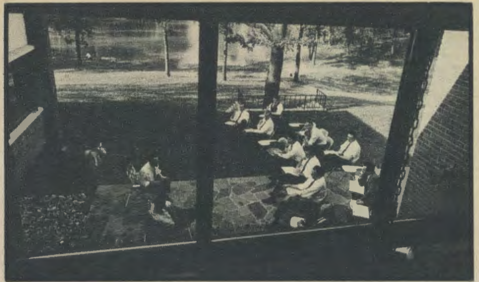
El Shellbourne Conference Center, que el Opus Dei dirige en Valparaíso, Indiana (Estados Unidos de América) realiza una amplia labor cultural sin discriminaciones de ningún tipo, para personas de toda clase, edad y condición.

"La santidad y el apostolado forman una sola cosa con la vida de los socios de la Obra, y por eso el trabajo es el quicio de su vida espiritual".