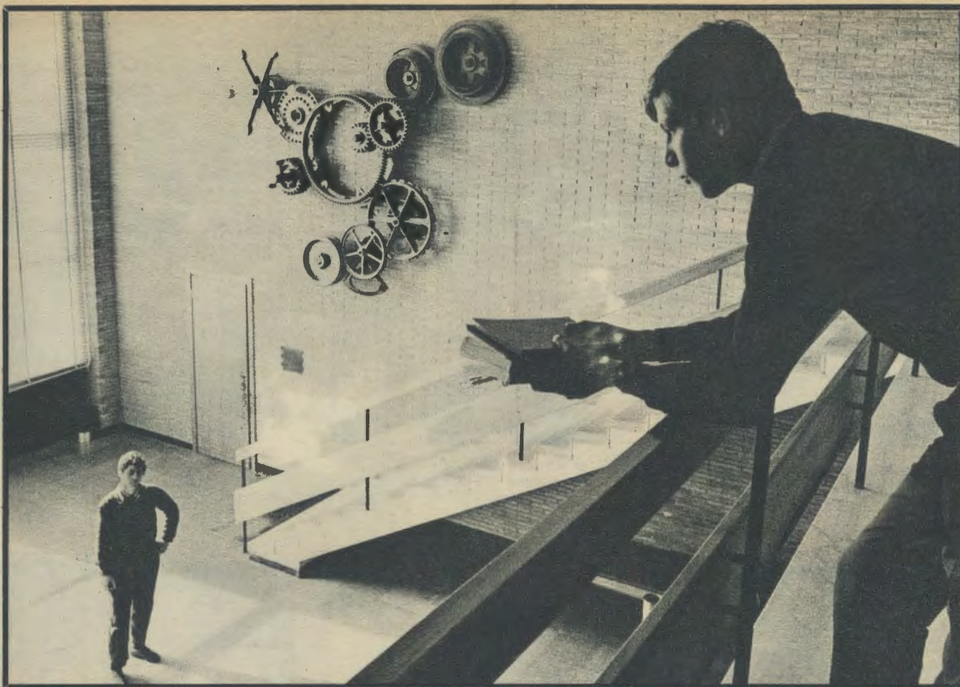
Original decoración en el atrio del centro ELIS, de formación laboral, que el Opus Dei dirige en el barrio Tiburtino, de Roma. Una placa, debajo de las grandes ruedas, recoge un punto de CAMINO que recuerda la importancia de la labor de cada uno para la marcha de todos los demás.

cir a las almas por los caminos de la vida cristiana, se llega al muro sacramental. La función santificadora del laico tiene necesidad de la función santificadora del sacerdote, que administra el sacramento de la Penitencia, celebra la Eucaristía y proclama la Palabra de Dios en nombre de la Iglesia. Y como el apostolado del Opus Dei presupone una espiritualidad específica, es necesario que el sacerdote dé también un testimonio vivo de ese espíritu peculiar.