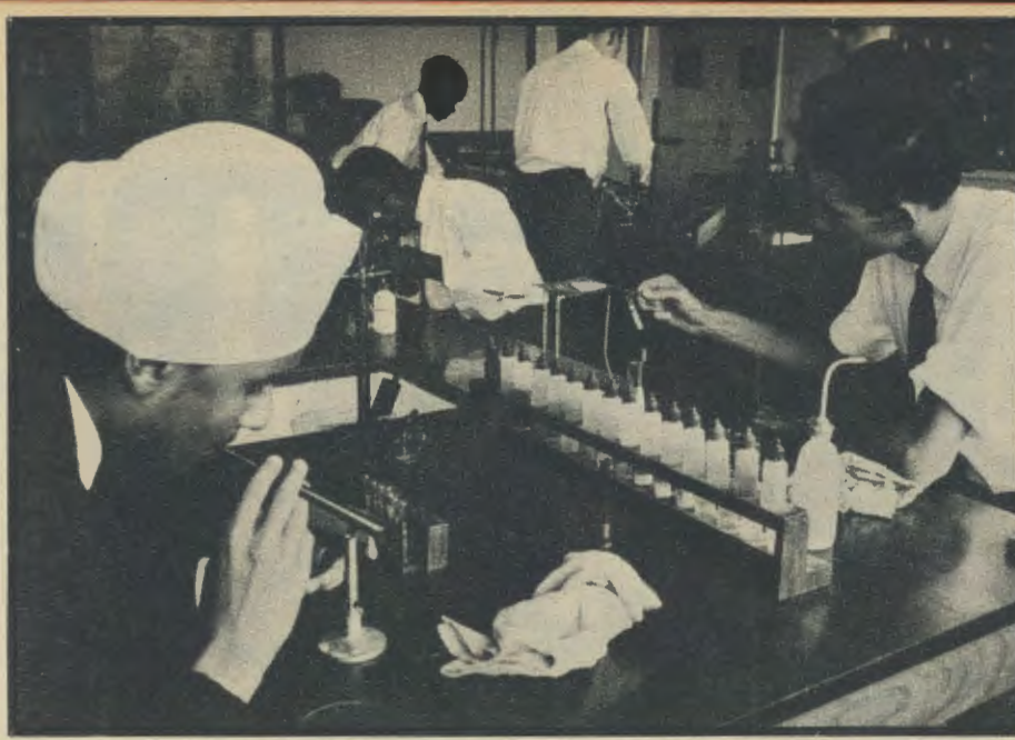
El primer centro interracial de Kenia, para la formación de estudiantes blancos y de color conjuntamente, fue fundado por el Opus Dei en Nairobi. Se llama Strathmore College y está contribuyendo eficazmente a la creación de una nueva conciencia ciudadana en el joven país africano.