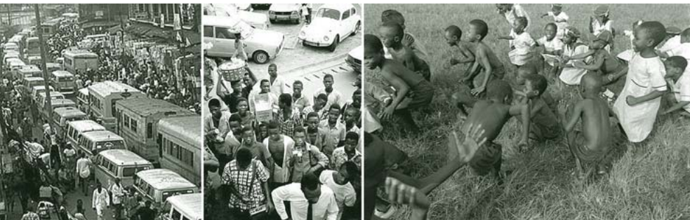
Europrof, Tilburg (Niederlande)