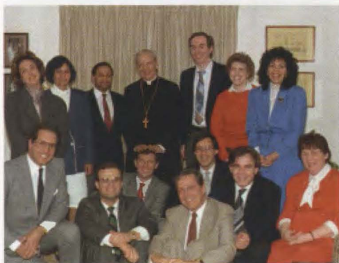
Koos kardinal Joseph Ratzingeriga, 1987.