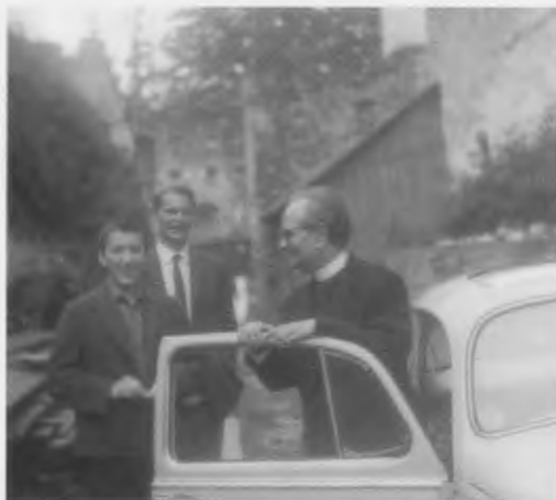
En els seus viatges per Anglaterra

Aprengué l'oferiment d'obres i a lluitar per tenir presència de Déu. Resava el Rosari, i feia una bona