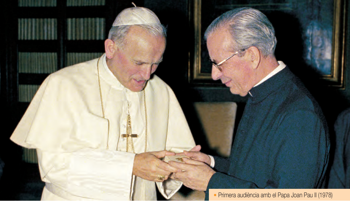
• Primera audiència amb el Papa Joan Pau II (1978)

Una qualitat patent en don Álvaro era el seu amor profund i filial vers el Sant Pare