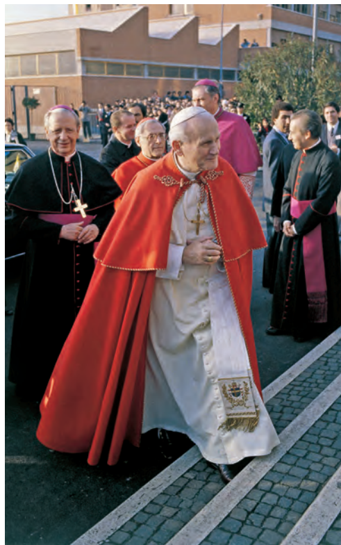
• Visita del Sant Pare al centre ELIS, Roma (1984)