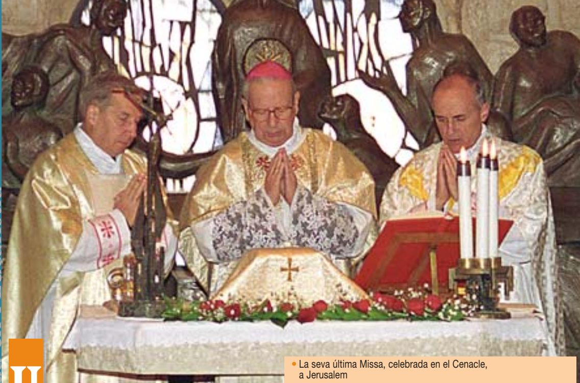
• La seva última Missa, celebrada en el Cenacle, a Jerusalem