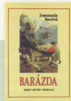
SOLC en hongarès

Els llibres del beat Josepmaria han estat traduïts a més de 40 idiomes. A la dreta, algunes portades de les seves obres en diverses llengües.