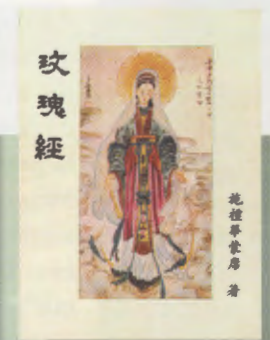
SANT ROSARI en xinès

de millorar la nostra vida, i que —per tant— es manifesta en obres de sacrifici i de donació d'un mateix. Tornar a la casa del Pare, mitjançant aquest sagrament del perdó en el qual, en confessar els nostres pecats, ens revestim de Crist i ens fem així germans seus, membres de la família de Déu.