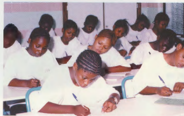
El curs de costura és una de les principals activitats del Lycée Professionel Kimbondo.