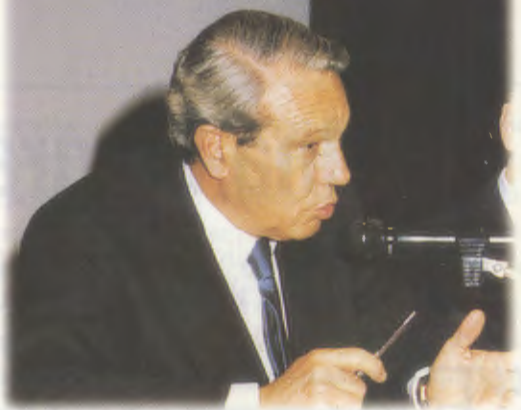
Joaquín Navarro-Valls, director de l'Oficina de Premsa de la Santa Seu.