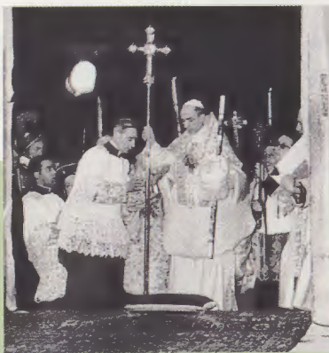
Roma, 24 de desembre de 1949. Pius XII, després d'obrir la Porta Santa, s'agenolla al llindar abans d'entrar a la Basílica de Sant Pere.