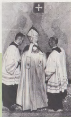
Roma, 26 de desembre de 1974. Pau VI a la Basílica, davant de la Porta Santa.

donar-ne de bons. (Mt 7, 17-18). Ningú no dóna allò que no té. El cristià és fecund només si lluita de veritat per a obtenir la santedat.