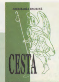
CAMÍ en eslovè