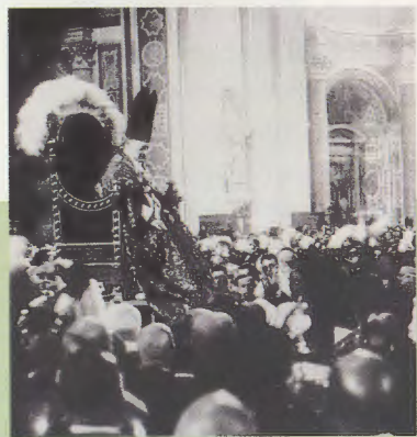
Roma, 1 d'abril de 1933. Pius XI, en cadira portàtil, a la Basílica de Sant Pere.

Juntament amb l'alegria, l'esperança era la virtut a la qual convidava amb més força a tots aquells que l'escoltaven. El gener de 1950, en unes cartes dirigides a fills seus de diversos països, els deia que si la seva lluita es feia més sincera, com a premi als seus esforços aquest Any Sant serà fecund . Els demanava empena en la lluita per a la santedat i en l'afany de sembrar la llavor cristiana pels camins divins de la terra. Tot arbre bo dóna fruits bons, i tot arbre dolent dóna fruits dolents. Un arbre bo no pot donar fruits dolents, ni un arbre dolent