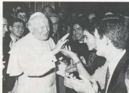
El Papa Joan Pau II entre els assistents a l'acte final del Congrés teològic.

3. La profunda consciència que té l'Església actual, d'estar al servei d'una redempció que afecta totes les dimensions de l'existència humana, va ser preparada, sota el guiatge de l'Esperit Sant, per un procés intel·lectual i espiritual gradual. El missatge del Beat Josepmaria, a qui heu dedicat les jornades del vostre Congrés, constitueix un dels impulsos carismàtics més significatius en aquesta direcció, partint precisament d'una singular presa de consciència de la força universal d'irradiació que posseeix la gràcia del Redemptor. En una de les