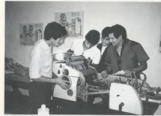
Durant una classe de tipografia.

Una part important de la història de Kinal és l'estada del Fundador de l'Opus Dei a Guatemala, el febrer de 1975. Foren pocs dies, però intensos, i plens d'una sembra apostòlica que des del primer moment va donar fruits abundants, multiplicats amb el pas dels anys. Kinal atén actualment més de cinc mil persones cada any, en els seus distints serveis, i promou com a objectiu central de la seva activitat la realització d'un treball ben fet i ple de sentit cristià. A part de la preparació tècnica completa, que implica