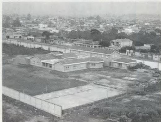
Kinal, el lloc on neix el foc.

Kinal és un vocable d'origen maia que significa "lloc on neix el foc"; en efecte, aquella primera guspira de generositat en uns joves, impulsats per l'afany de servei als altres que irradiava el Fundador de