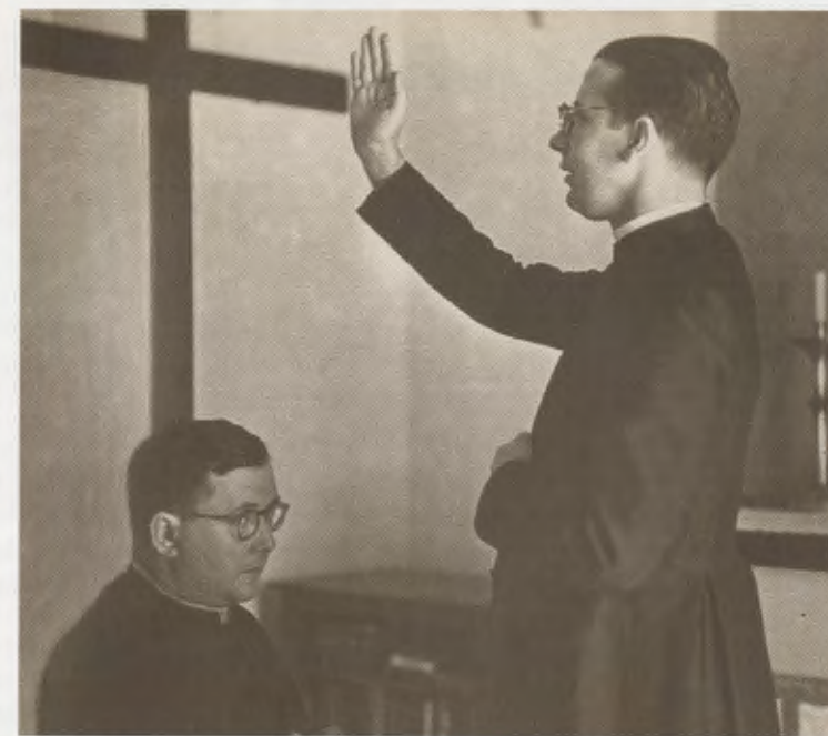
Mons. Álvaro del Portillo, tot just ordenat sacerdot, beneeix el Beat Josepmaria Escrivà de Balaguer, 26 de juny de 1944.

manguessin incardinats al servei de l'Opus Dei. La llum de Déu va arribar el 14 de febrer de 1943. El Beat Josepmaria ho recordava així: el Senyor, que va voler servir-se de la burra de Balaam, s'ha servit també d'aquest Pare vostre com a instrument. El 14 de febrer de 1943, jo vaig començar la Missa buscant la solució jurídica per poder incardinar a l'Obra els sacerdots. Feia molt de temps que tractava de trobar-la, però sense resultat. I aquell dia, intra missam, després de la comunió, el Senyor me la va voler donar: la Societat Sacerdotal de la Santa Creu. Fins i tot em va donar el segell: l'esfera del món amb la creu inscrita. Fou a Madrid, en una casa que les vostres germanes tenien al carrer de Jorge Manrique (4). Després de preparar la documentació necessària, el maig de 1943 D. Álvaro va anar a Roma per sol·licitar el necessari nihil obstat de la Santa Seu, que fou concedit el dia 11 d'octubre, llavors festivitat de la Maternitat Divina de Maria. L'erecció diocesana de la Societat Sacerdotal de la Santa Creu tingué lloc el 8 de