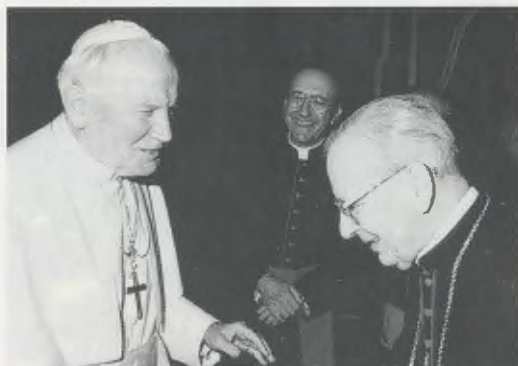
S.E.R. Mons. Álvaro del Portillo saludà el Sant Pare en l'audiència concedida a la Sala Clementina.

A més de la santificació de les ànimes, l'acció de l'Esperit Sant té com a finalitat la renovació constant de l'Església, perquè pugui complir amb eficàcia la missió que Crist li ha encomanat. En la història recent de la vida eclesial, aquest procés de renovació té un punt de referència fonamental: el Concili Vaticà II, durant el qual l'Església, reunida en assemblea en les persones dels seus bisbes, reflexionà novament en el nucli del seu misteri, a fi de poder anunciar l'Evangeli al món, i influir així decisivament en la vida dels homes, en les cultures i en els pobles. Els treballs conciliaris, i els documents que se'n van concloure, tingueren com a característica comuna la plena consciència de la salvació, duta a terme i obtinguda per Crist. D'ací se'n deriva el sentit de missió que posen de relleu els textos d'aquesta assemblea ecumènica i de tot el magisteri successiu; a aquest sentit de missió m'he referit fa poc en la carta encíclica Veritatis splendor .