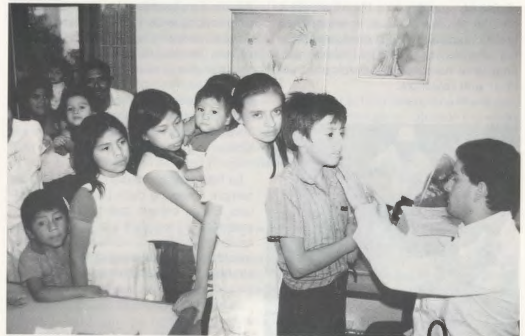
Campanya de vacunació a la clínica de consulta externa de Kinal.

coneixements especials i pràctiques en tallers amb equips de tecnologia avançada, s'ensenya molt especialment l'interès constant per voler fer ben feta i de cara a Déu la tasca diària, afany de superació, tenir cura dels detalls, esperit de servei, acabar les coses fins el final, posar la darrera pedra , com li agradava de repetir al Beat Josepmaria.