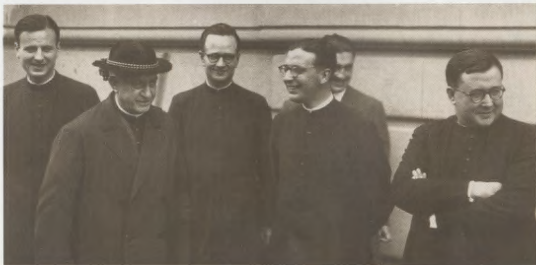
El Fundador de l'Opus Dei amb el Bisbe de Madrid i els seus tres primers fills sacerdots de l'Obra, el 25 de juny de 1944.

Per als seus estudis teològics, buscà el millor professorat; entre altres, alguns professors d'ateneus pontificis romans, als quals l'esclat de la II Guerra Mundial els havia sorprès a Espanya, on es van veure obligats a romandre. Alguns, més tard, van ser consagrats bisbes.