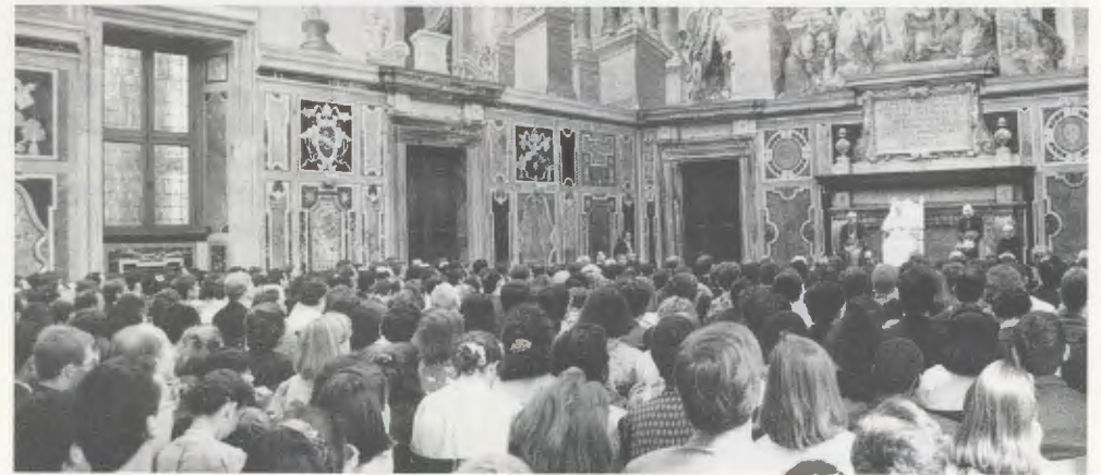
Roma, 14 d'octubre de 1993. El Sant Pare Joan Pau II dirigí unes paraules als participants en el Congrés teològic d'estudi sobre els ensenyaments del Beat Josepmaria Escrivà.

El 14 d'octubre, els 500 congressistes foren rebuts en audiència per S.S. Joan Pau II. Publiquem a continuació, les paraules dirigides pel Sant Pare als participants en el Congrés.