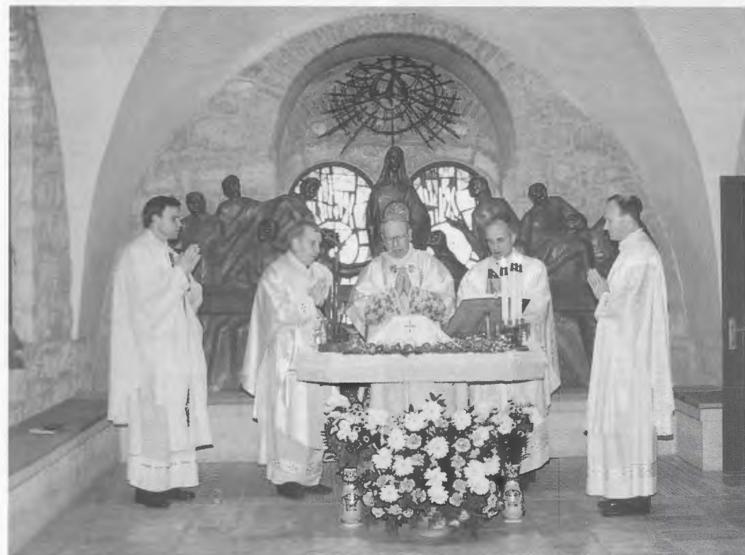
Jerusalem, 22 de març de 1994. Mons. del Portillo celebrà la seva darrera Missa a l'església del Cenacle.