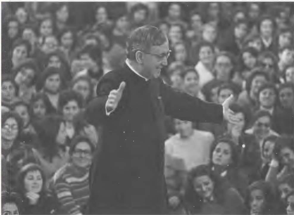
En una tertúlia a Brafa, Barcelona, el 25 de novembre de 1972.

vem la intenció de la meva germana, per intercessió del Servent de Déu. Una altra germana diu que tots els matins resava per Sor Concepción davant d'una estampa del Fundador de l'Opus Dei, mentre feia la neteja de la casa.