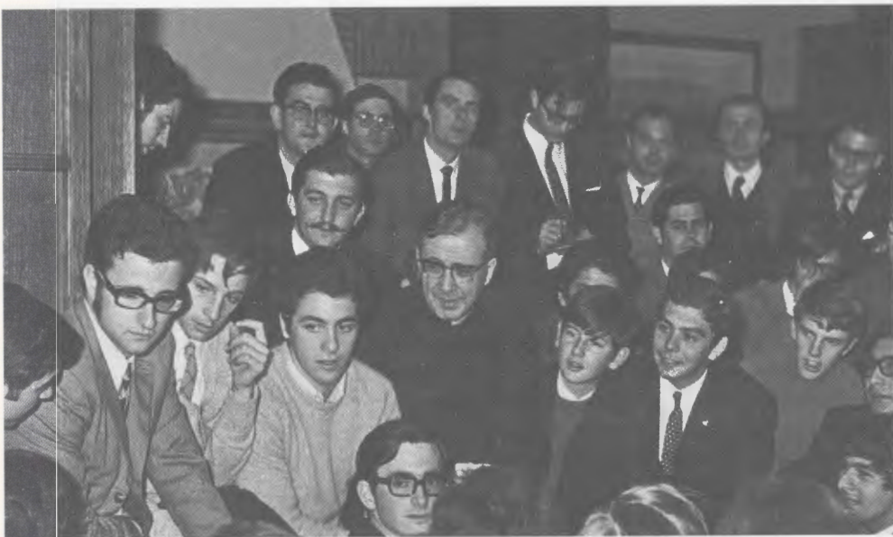
Roma, 26 de març de 1970.