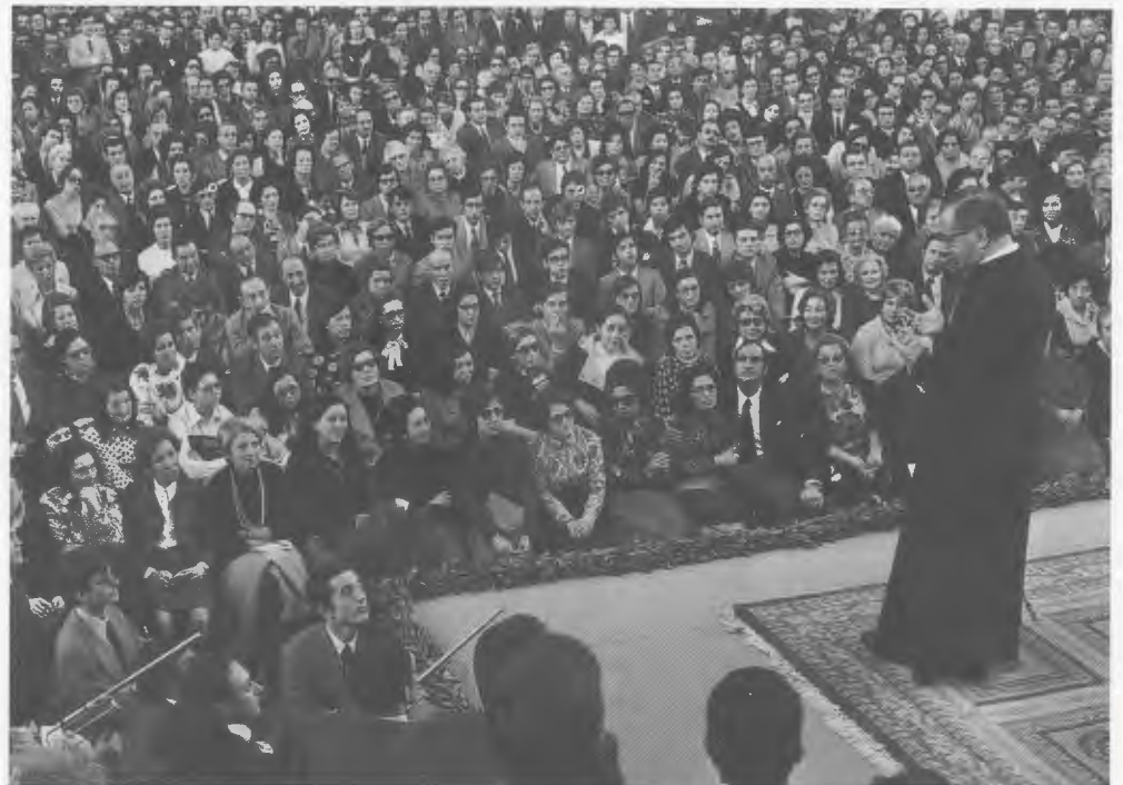
Durant una tertúlia a Brafa, Barcelona, el 22 de novembre de 1972.

Simultàniament a la curació dels tumors, es va verificar una progressiva desaparició de les molèsties gàstriques que Sor Concepción havia patit des de 1972: van cessar de repent les hemorràgies, el procés d'anèmia va començar a normalitzar-se i a les radiografies no s'hi apreciaven senyals d'úlcera gàstrica. El Prof. Ortiz de Landázuri ha declarat: Des d'aquella nit del mes de juny de 1976, l'evolució de la malalta va continuar també d'una manera sorprenent.