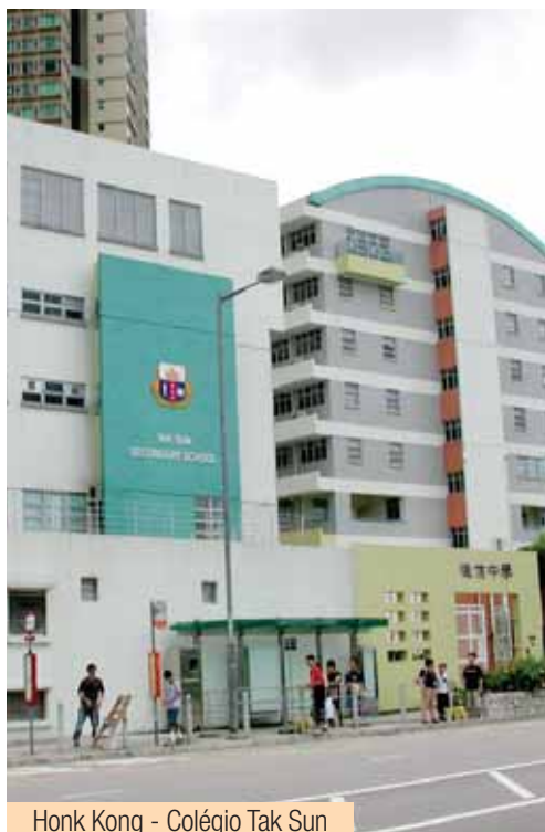
Honk Kong - Colégio Tak Sun

peças, entre as quais algumas do Opus Dei, aceitou o desafio de assumir a direcção da antiga escola primária Tak Sun School, então com 70 anos de