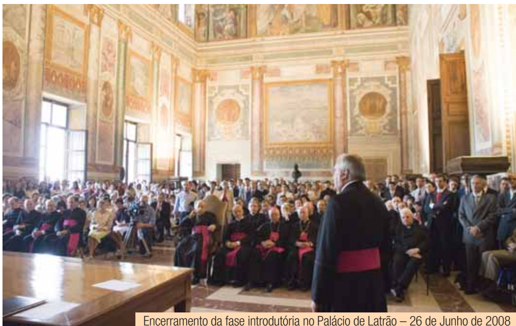
Encerramento da fase introdutória no Palácio de Latrão – 26 de Junho de 2008