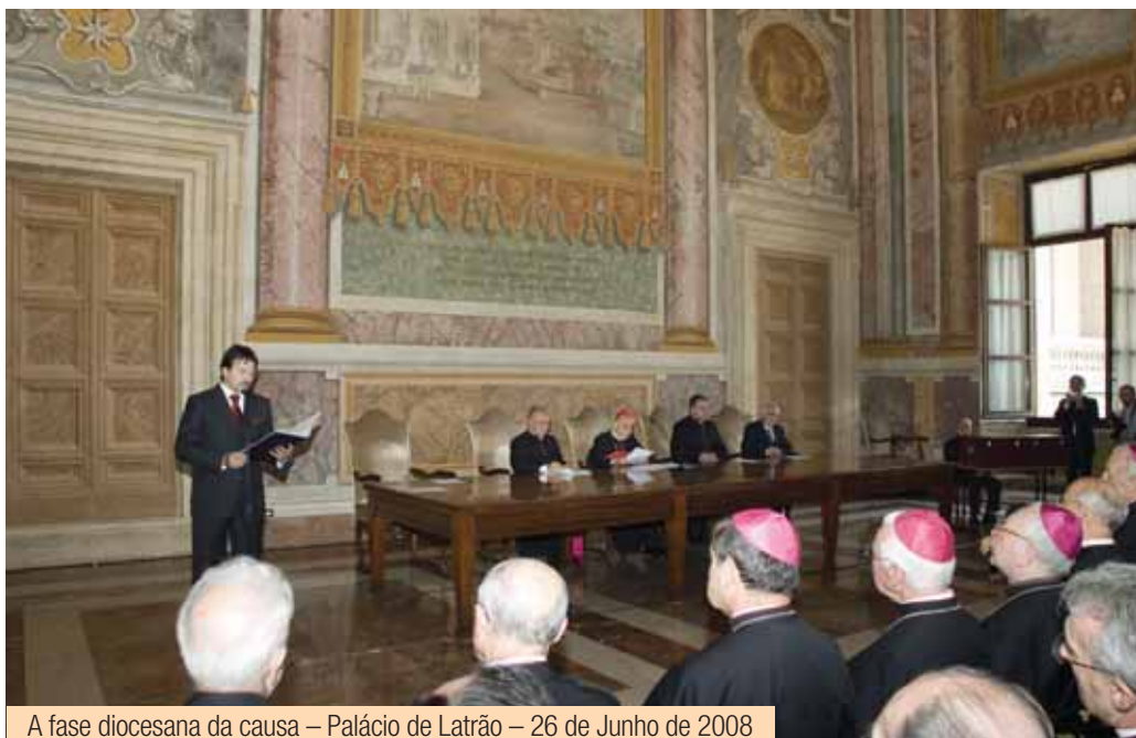
A fase diocesana da causa – Palácio de Latrão – 26 de Junho de 2008

to outros, se fizeram com a colaboração dos correspondentes tribunais das Dioceses nas quais se encontravam as testemunhas. Entre outros, colaboraram os tribunais de Madrid, Pamplona, Leiria-Fátima, Montreal, Quito, Sydney, Varsóvia e Washington.