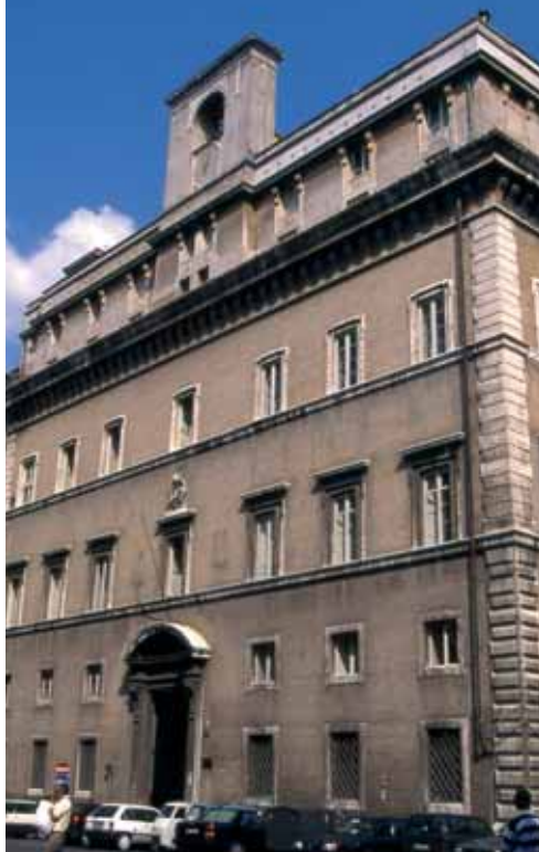
• Palácio del Apollinare, sede da Pontifícia Universidade da Santa Cruz.