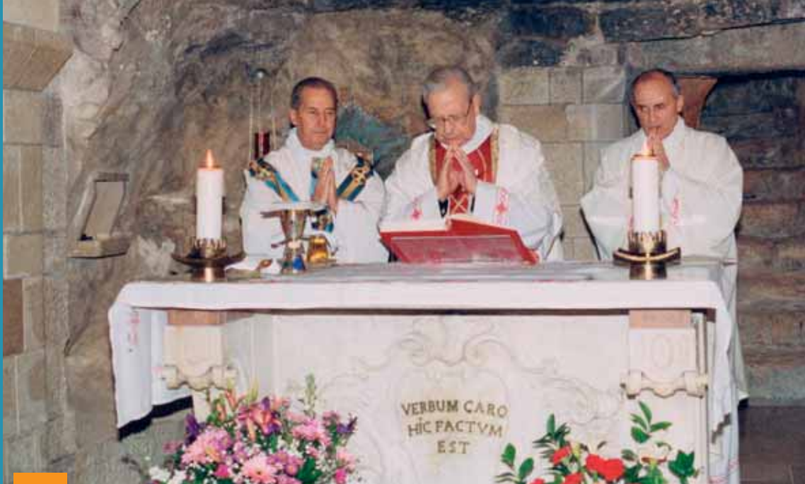
• Celebrando a Santa Missa na gruta da Anunciação, em Nazaré, no dia 15 de Março de 1994.