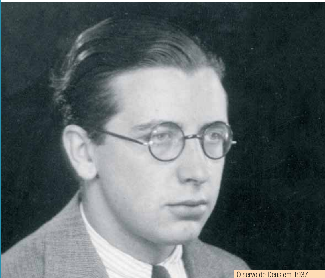
O servo de Deus em 1937

O encontro com S. Josemaria e a decisão de se entregar a Deus no Opus Dei, no dia 7 de Julho de 1935