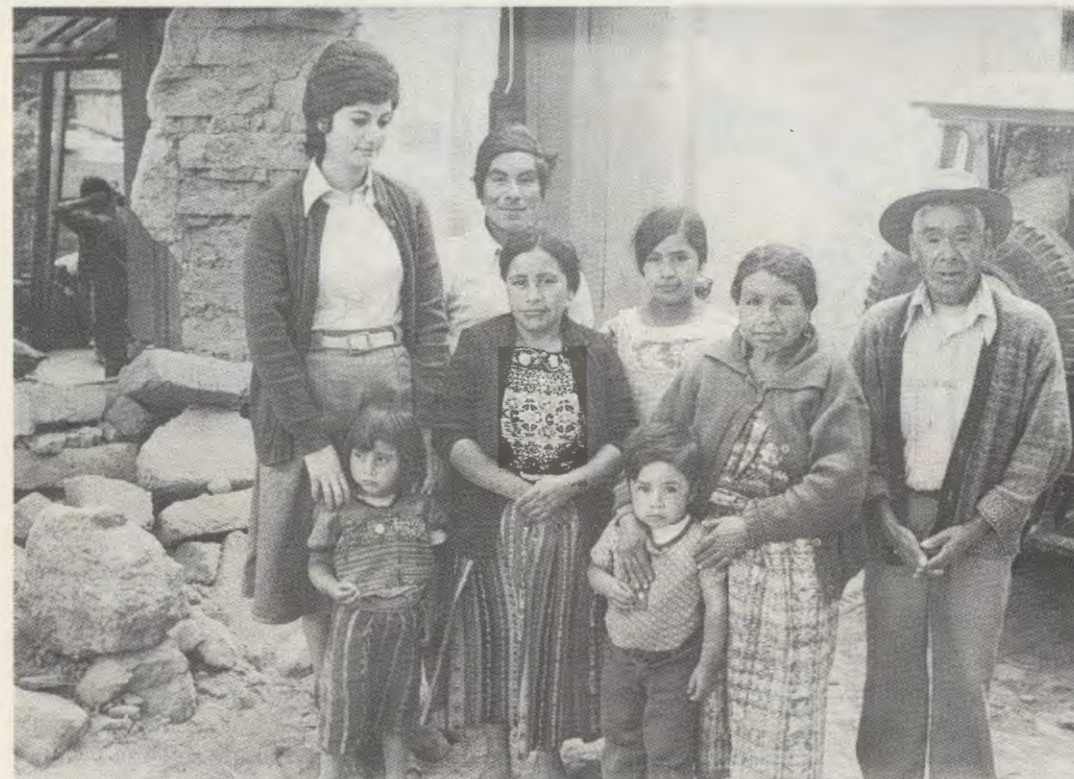
A acção do IFES chega a um grande número de povoações da Guatemala.

sede do IFES, o Instituto Feminino de Estudos Superiores. A sede anterior, inaugurada em 1964, tinha ficado pequena face ao aumento do número de alunas e ao desencadear de novas iniciativas.