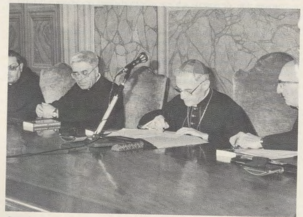
O Cardeal Poletti, Vigário do Papa para a diocese de Roma, assina as actas da sessão de encerramento do Processo, como Presidente do Tribunal. Roma, 8 de Novembro de 1986.

Passaram mais de seis anos desde que o Vigário de Roma, Cardeal Ugo Poletti, promulgou o Decreto de Introdução da Causa para a Beatificação e Canonização, em 19 de Fevereiro de 1981. Durante este tempo, os juizes eclesiásticos ouviram e recolheram as declarações das testemunhas, num total de trezentas e setenta e quatro sessões. No dia 26 de Junho de 1984 terminou um trabalho paralelo perante o tribunal da Arquidiocese de Madrid, que ouviu um grande número de testemunhas em língua castelhana. Também em Madrid terminaram dois processos sobre curas de carácter extraordinário atribuídas à intercessão de Mons. Escrivá: o desaparecimento instantâneo de uma doença tumoral e a cura de um linfoma maligno.