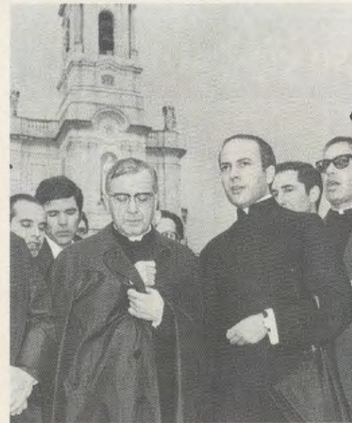
Fátima, 2 de Novembro de 1972. O Servo de Deus, rodeado de vários membros do Opus Dei, reza o Terço na explanada do Santuário.

sempre itinerários que iam dar a santuários marianos; e as suas catequeses pela América em 1974 e 1975 estão marcadas por escalas marianas: Nossa Senhora da Aparecida (Brasil), Nossa Senhora de Luján (Argentina), Nossa Senhora de Lo Vásquez (Chile).