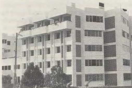
Sede do IFES.

Em Fevereiro de 1975, poucos meses antes da sua morte, Mons. Escrivá de Balaguer esteve alguns dias na Guatemala, no fim do seu terceiro percurso de catequese pela América. Tal como as anteriores, esta viagem foi uma sementeira abundante de doutrina; movido pelo seu desejo de servir cada vez mais generosamente a Igreja, o Servo de Deus impulsionou as suas filhas e filhos a realizarem um apostolado amplo e fecundo, dirigido a iluminar cristãmente a sociedade inteira. Naquelas jornadas, cheio de esperança, abençoou uns terrenos situados a sul da capital guatemalteca, em que iam iniciar-se as obras da nova