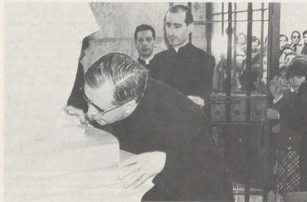
O Servo de Deus beija os pés da imagem de Santa Maria, Mãe do Amor Formoso, na ermida do campus da Universidade de Navarra, no dia 23 de Abril de 1967.

nha Mãe! Mãe!; só te tinha a Ti!; obrigado! 6