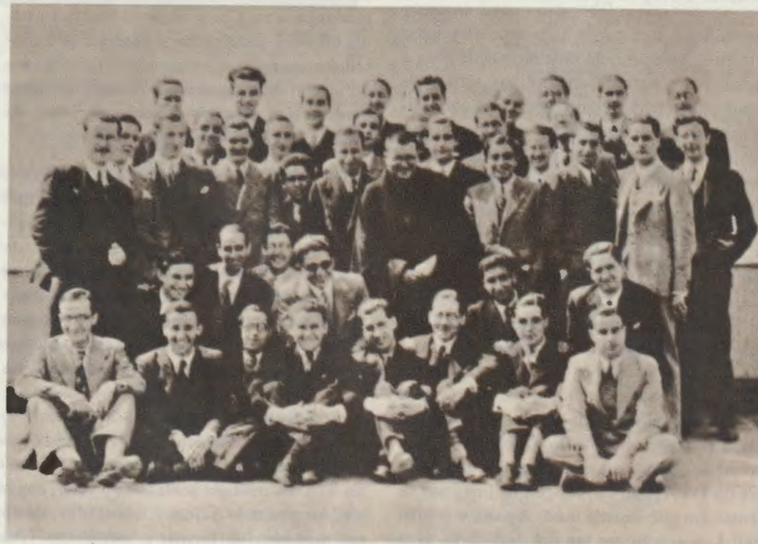
O Servo de Deus com alguns estudantes de DYA.

D. Josemaría entregou-se com total empenho a esta tarefa, dedicando-lhe grandes esforços e muitíssimas horas. Ensinava esses rapazes a viver a ordem, a aproveitar o tempo, a estar alegres, a ser sinceros e piedosos, a amar o sacrifício que o cumprimento fiel do dever encerra... Num pequeno gabinete de trabalho singelamente mobilado, recebia D. Josemaría os muitos que ali acorriam em busca de conselho e orientação. De uma das paredes pendia uma cruz de madeira, sem crucifixo; e o sacerdote explicava-lhes, às vezes, o que mais tarde deixou escrito em Caminho : Quando vires uma pobre Cruz de pau, só, desprezível e sem valor... e sem Crucifixo, não esqueças que essa Cruz é a tua Cruz: a de cada dia, a escondida, sem brilho e sem consolação..., que está à espera