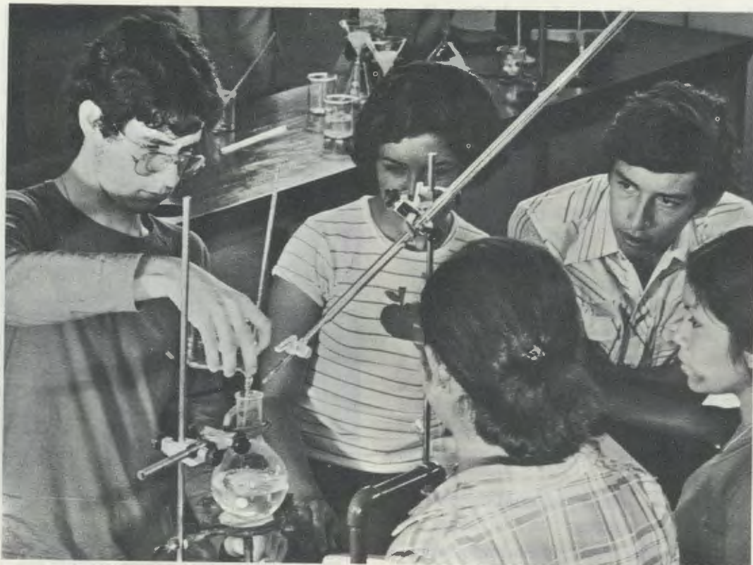
No Laboratório de Química

Só 13% dos estudantes pagam as propinas na sua totalidade. Uma pequena percentagem paga um montante reduzido. A maior parte recebe ensino gratuito, dada a sua precária condição económica. A Universidade procura, portanto, apoio na generosidade de muitas pessoas; a isto soma-se o trabalho que as oficinas de Engenharia oferecem às empresas.