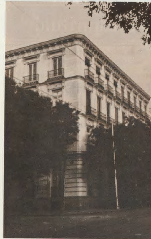
Neste edificio da rua Ferraz, n.º 50 (Madrid), a partir de 1934, ocupou a Residência DYA dois andares do penúltimo piso; a Academia estava noutro andar do último piso.