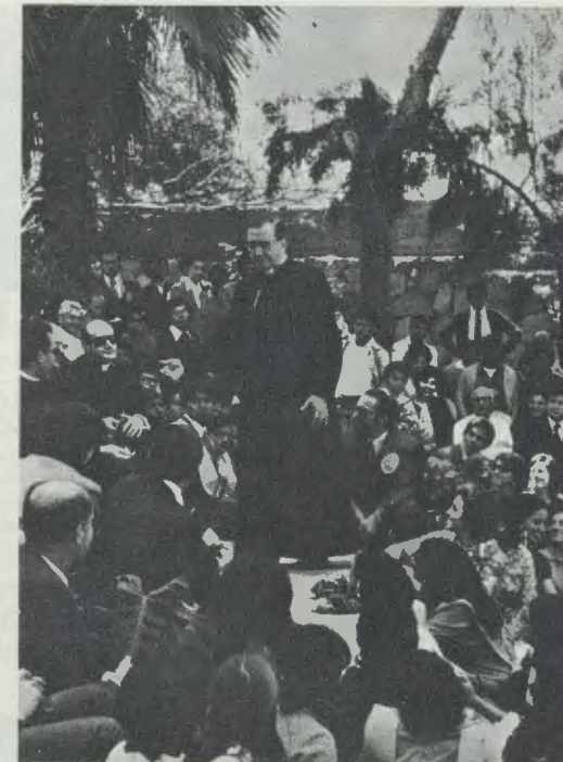
O Servo de Deus em Larboleda, próximo de Lima (Peru), no dia 29-VII-74: na tertúlia participaram vários professores e alunos da Universidade de Piura.

São palavras significativas do constante alento que o Fundador infundiu nessa empresa universitária. Com base nessa orientação se construiu um projecto educativo que corresponde às exigências da região, e em particular à procura de profissionais bem preparados. Os mais de mil e quinhentos estudantes da Universidade repartem-se, actualmente, pelas Faculdades de Artes Liberais, Ciências da Engenharia, Engenharia Industrial, Ciências da Informação e Administração de Empresas. Além dos cursos académicos normais, a Universidade criou um Serviço de Extensão Cultural que desen-