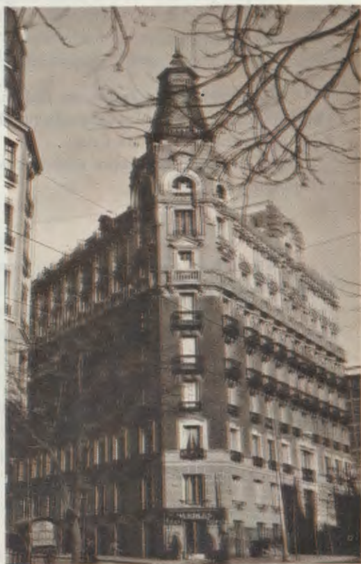
Na sobreloja deste edifício de Madrid, na rua Luchana, teve a sua sede a Academia DYA, de fins de 1933 até aos começos do ano lectivo de 1934-35.

No ano de 1933, quando já tinha conseguido reunir um bom grupo de universitários,