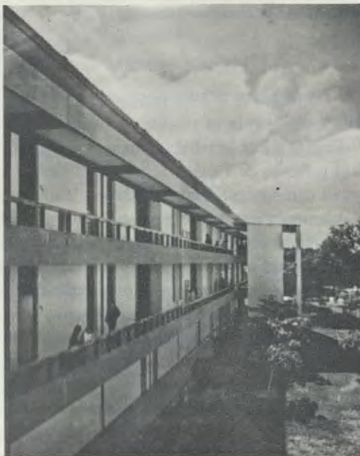
Um edifício da Universidade.

Num areal, que só produz alfarroba, nasceu em 1968 a Universidade de Piura, fruto da convergência de um duplo empenho: por um lado, a iniciativa apostólica de um grupo