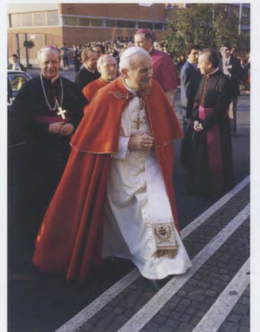
• Visita del Santo Padre al centro ELIS, Roma (1984).