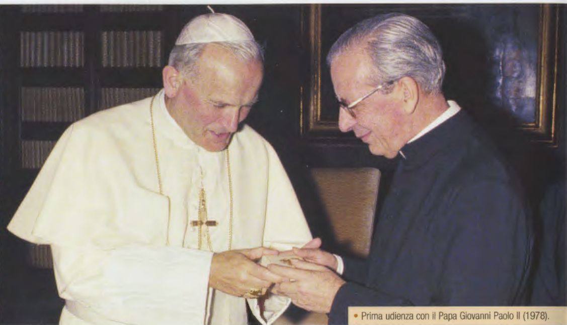
• Prima udienza con il Papa Giovanni Paolo II (1978).