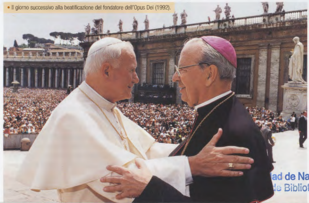
• Il giorno successivo alla beatificazione del fondatore dell'Opus Dei (1992).

vita e di efficacia apostolica nella Chiesa. Il Signore lo ha detto con la massima chiarezza: Come il tralcio non può far frutto da se stesso se non rimane nella vite, così anche voi se non rimanete in me (Gv 15, 4). Per rimanere in Cristo è assolutamente necessaria l'unione totale con il suo Vicario sulla terra, il Romano Pontefice». Il Servo di Dio ha aiutato molti cristiani a vivere l'unione filiale con il Santo Padre mediante il suo luminoso esempio di amore per il Papa, che lo ha portato a spendersi generosamente per estendere il Regno di Cristo - Regnare Christum volumus , "vogliamo che Cristo regni!", era il suo motto episcopale -, e mediante la sua predicazione incessante: «Dobbiamo essere molto romani, con il nostro amore al Successore di Pietro, e questo si manifesta nelle preghiere e nelle mortificazioni per la sua Persona e le sue intenzioni, nella fedeltà ai suoi insegnamenti e nell'obbedienza devota alle sue indicazioni». ▲