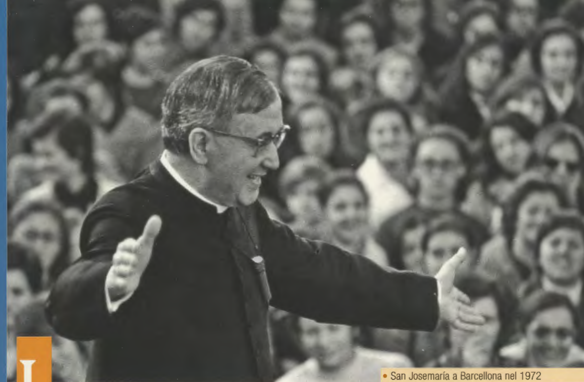
• San Josemaría a Barcellona nel 1972

Coloro che ottengono grazie per intercessione di San Josemaría Escrivá sono pregati di inviarne comunicazione alla Prelatura dell'Opus Dei, Ufficio per le Cause dei Santi, via A.da Giussano 6, 20145 Milano e-mail: info@opusdei.it