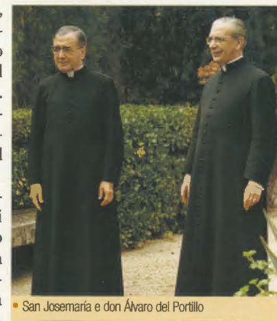
• San Josemaría e don Álvaro del Portillo

Davanti al suo sguardo c'erano le finestre, ancora illuminate, delle stanze pontificie. L'immaginazione alimentava nel suo cuore il profondo affetto che pure aveva espresso su Cammino : «Grazie, mio Dio, per l'amore al Papa che hai messo nel mio cuore».